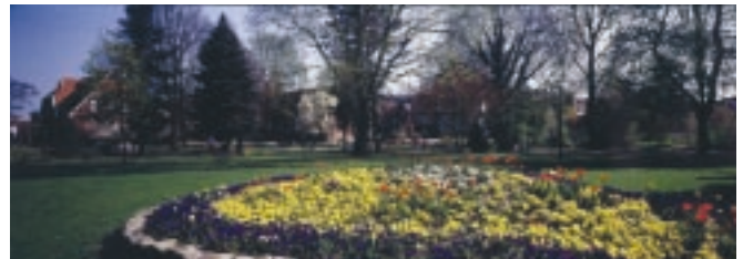
Blumeninsel in Park „Hof Deitmar“

Die weitläufige Flusslandschaft, bei der die Erhaltung des ökologischen Gleichgewichts einen breiten Raum einnimmt, bestimmt auf vielfältige Weise die Lebensqualität der ganzen Stadt. Der Fluss ist eine wichtige Feuchtgebietsachse im Münsterland und auch nach seinem Ausbau in Teilbereichen ein wichtiger Lebensraum für selten gewordene Pflanzen und Tiere.