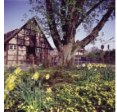
Frühling in Emsdetten

Dazu tragen die geschmackvoll restaurierten Geschäftshäuser bei, die in der Regel seit mehreren Generationen von Emsdettener Familien geführt werden.