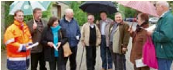
Der Seniorenring besucht die „neue bahn stadt: Opladen“

Möglichkeit ab 20.00 Uhr, auf Wunsch zwischen zwei Haltestellen auszusteigen. Dieser Service soll zur Erhöhung des Sicherheitsgefühls der Fahrgäste beitragen. Auch hier dem Fahrer bitte rechtzeitig Bescheid sagen.