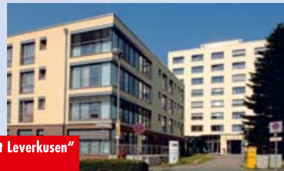
AWO-Seniorenzentrum „Stadt Leverkusen“ in Leverkusen-Schlebusch