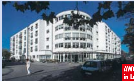
AWO Seniorenzentrum „Rheindorf“ in Leverkusen-Rheindorf