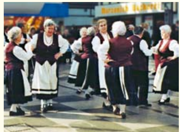
Tag der älteren Generation