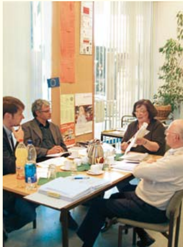
Der Seniorenring im Gespräch mit Vertretern des IAT Gelsenkirchen zum Thema „Wachsen im Alter“

(Hilfen, finanzielle Leistungen, Kündigungsschutz) Miselohestr. 4, 51379 Leverkusen-Opladen, Raum 005 Tel. 02 14/4 06-50 61; -50 62; -50 63 Fax 02 14/4 06-50 02