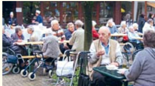
Senioren pflegen die Geselligkeit