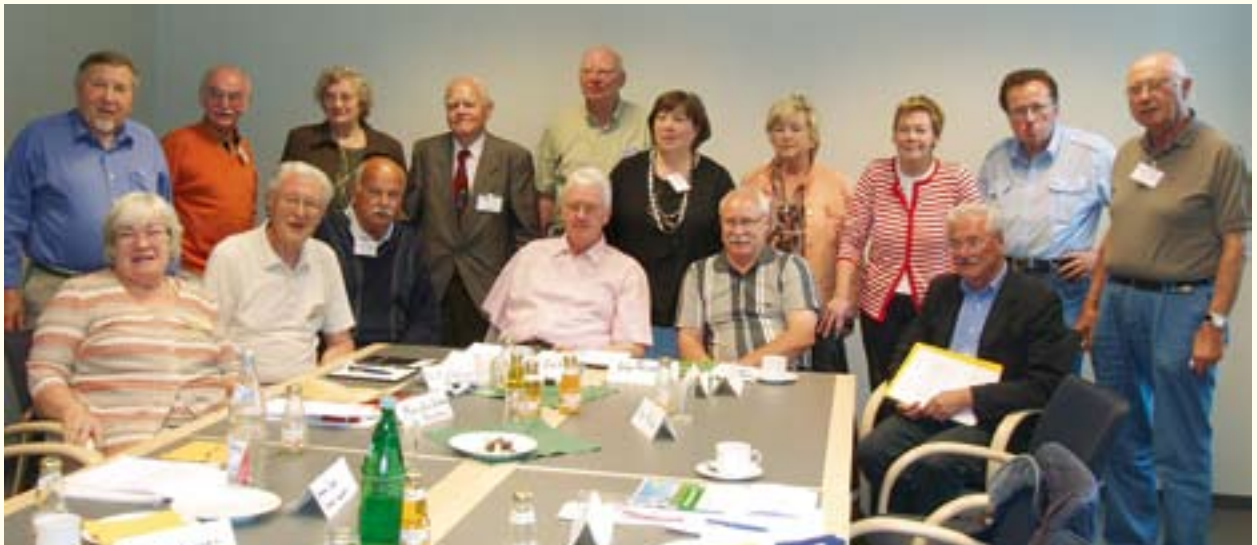
Erfahrungsaustausch des Seniorenrings Leverkusen mit den Seniorenvertretungen der Nachbarkommunen

Kostenlose Beratung für Patienten und Angehörige, Information über spezialisierte Pflegedienste, Begleitung, Hospizdienst, Patientenverfügung, Möglichkeiten einer stationären Versorgung im Hospiz, Hintergrund- und Notfalldienste sowie der Kontakt zu spezialisierten Palliativmedizinern wird angeboten.