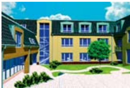
in Leverkusen – Lützenkirchen