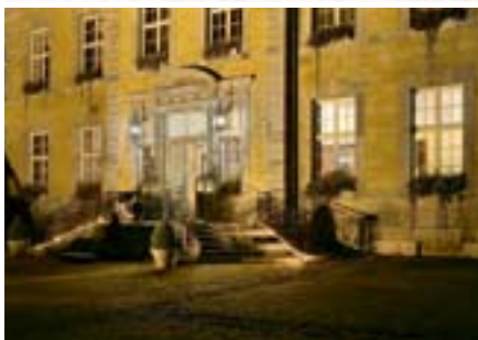
Stimmungsvolle Beleuchtung im Innenhof.