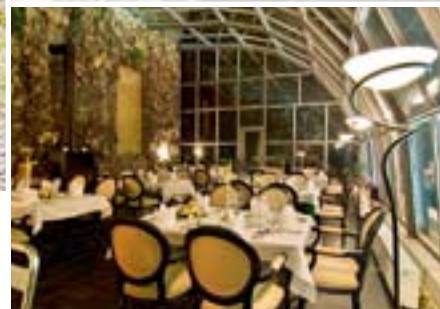
Festliche Gedecke im Wintergarten.