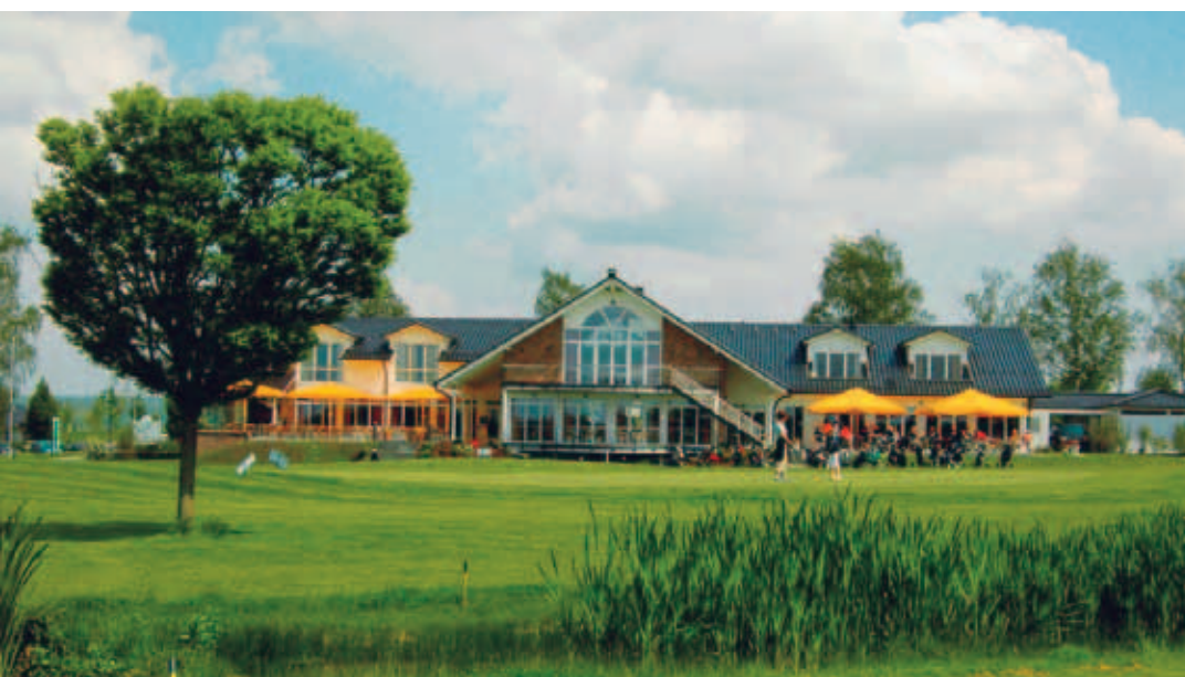
Golfclub Gut Heckenhof