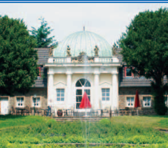
Schloss Merten, Orangerie