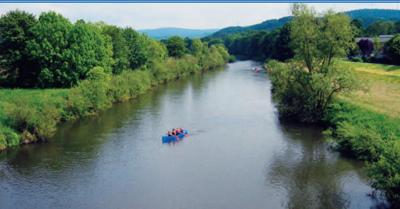
Kanuwandern auf der Sieg