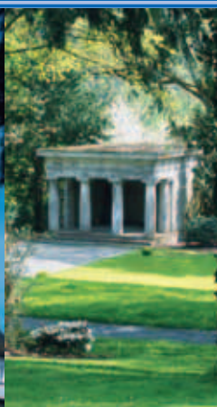
Schloss Merten, Pavillon