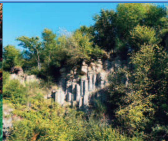
Naturschutzgebiet Basaltsteinbruch Stein