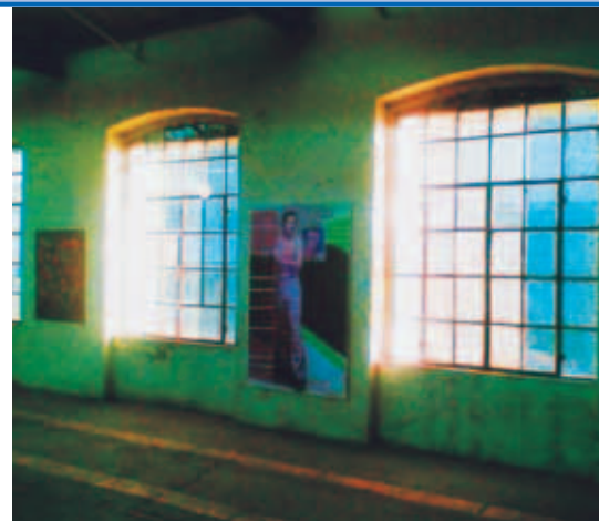
... Kunst in der Werkshalle