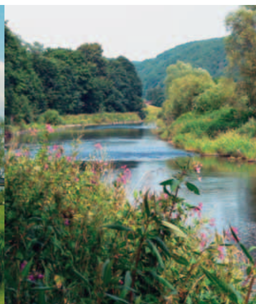
Familienfreundlicher Radweg entlang der Sieg