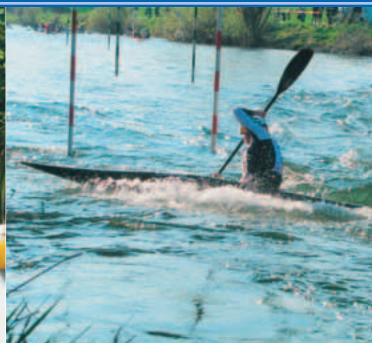
Kanuslalom auf der Sieg