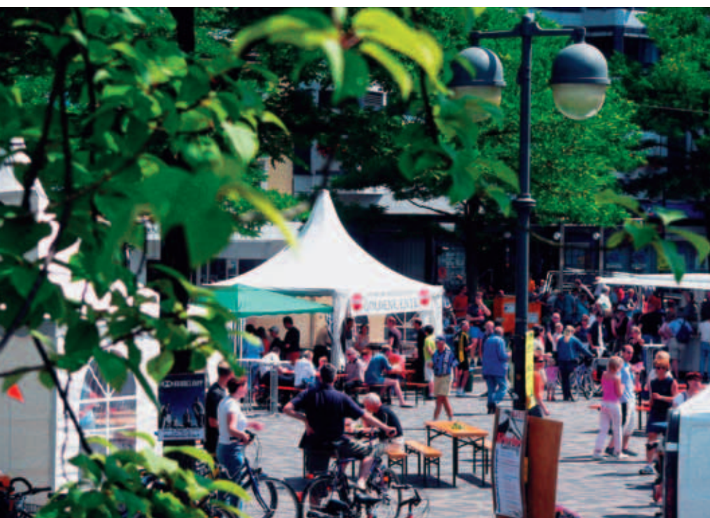
„Siegthal pur“ – autofreies Siegtal

Die traditionsreiche Eitorfer Großkirmes ist die größte Kirmes im Rhein-