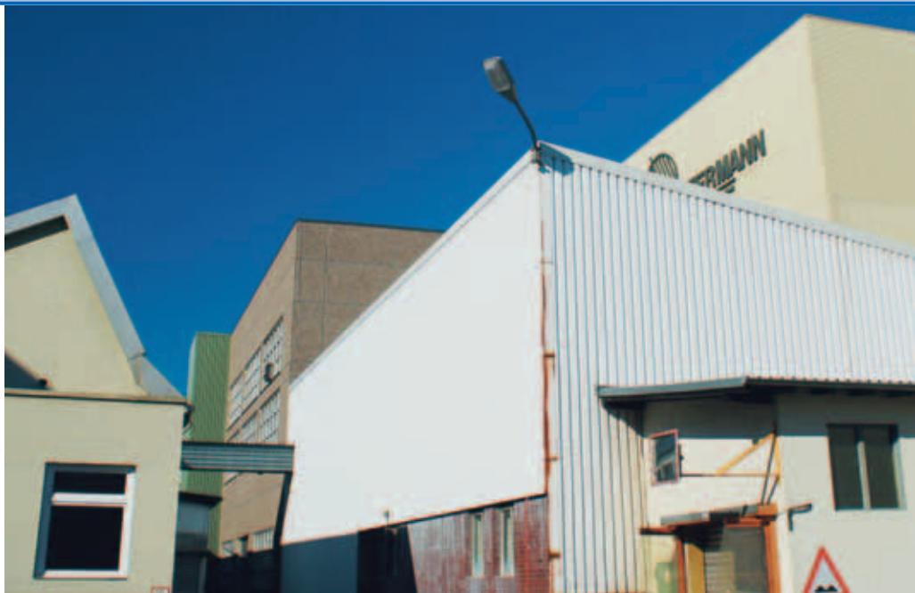
Gewerbehof an der Kammgarn