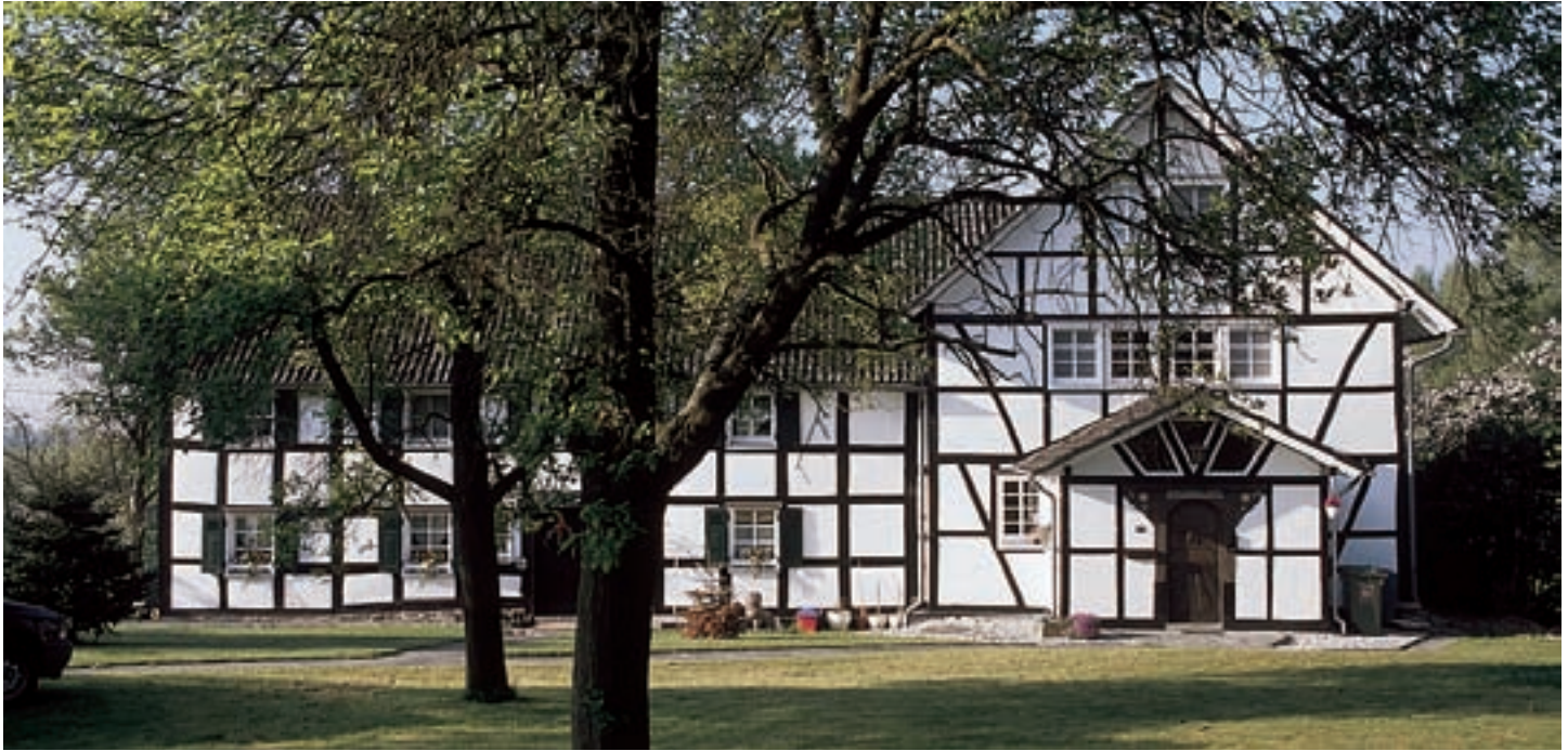
Fachwerkhause in Remschoss

Die ca. 21.000 Einwohner zählende Gemeinde Neunkirchen-Seelscheid, zu der zahlreiche kleinere Ortschaften gehören, liegt im südlichen Teil des Bergischen Landes. Bröl-, Wahn- und Naafbach gliedern mit den sie begleitenden Höhenzügen das 5064 Hektar große Gemeindegebiet. Die von 1955 bis 1958 angelegte Wahnbachtalsperre prägt mit einer Wasserfläche von 225 Hektar und einem Fassungsvermögen von 41,5 Millionen Kubikmetern Wasser das Landschaftsbild und ist für die Wasserversorgung großer Gebiete äußerst wichtig. Aussichtspunkte auf den Höhenrücken der reizvollen Landschaft mit Wiesen- und Weideflächen, Äckern, Laub- und Nadelwäldern bieten immer wieder überraschende Ausblicke bis Köln und ins Siebengebirge. Das infolge der durch-