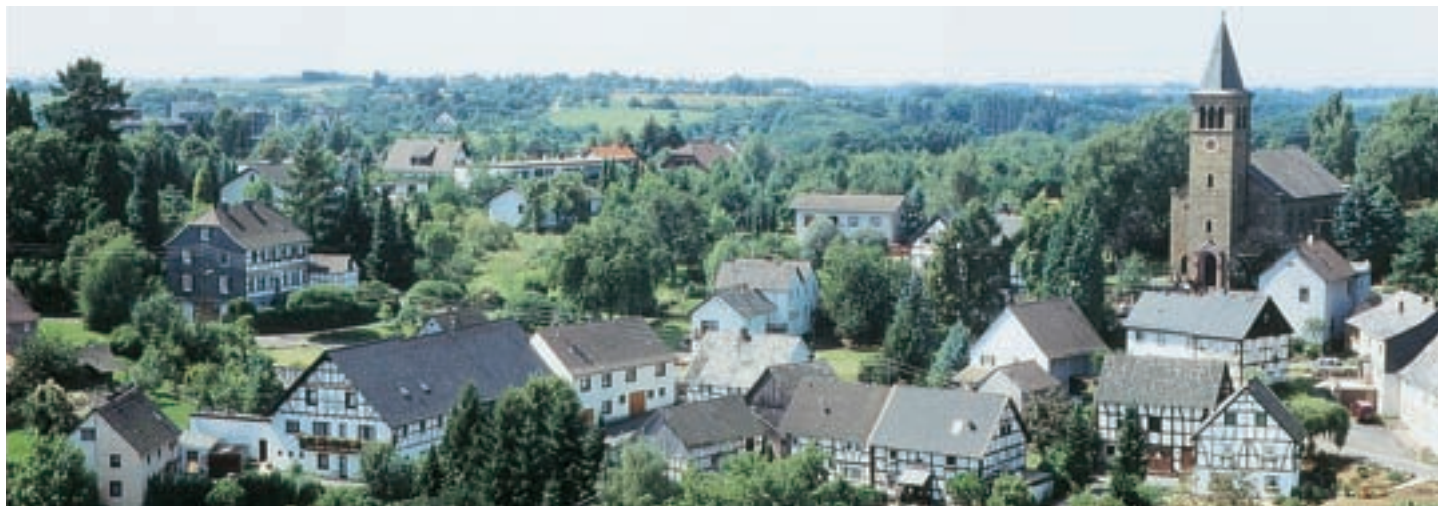
Ansicht auf Dorf Seelscheid mit der evangelischen Kirche