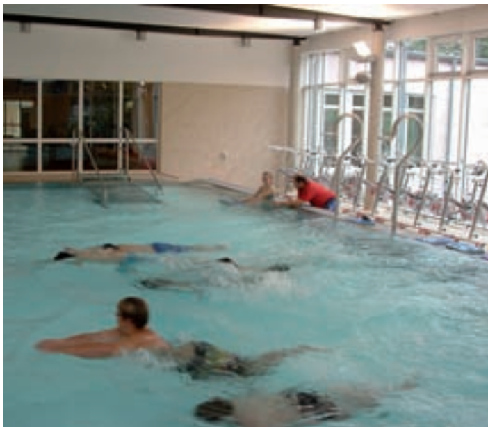
Variobecken mit Aqua-Bikes und Massagedüsen

Das bis zu einer Wassertiefe von 1,80 m stufenlos höhenverstellbare Variobecken hat eine Größe von 12,5 x 8 Metern und durchgehend 30 ° C Wassertemperatur. Zwei