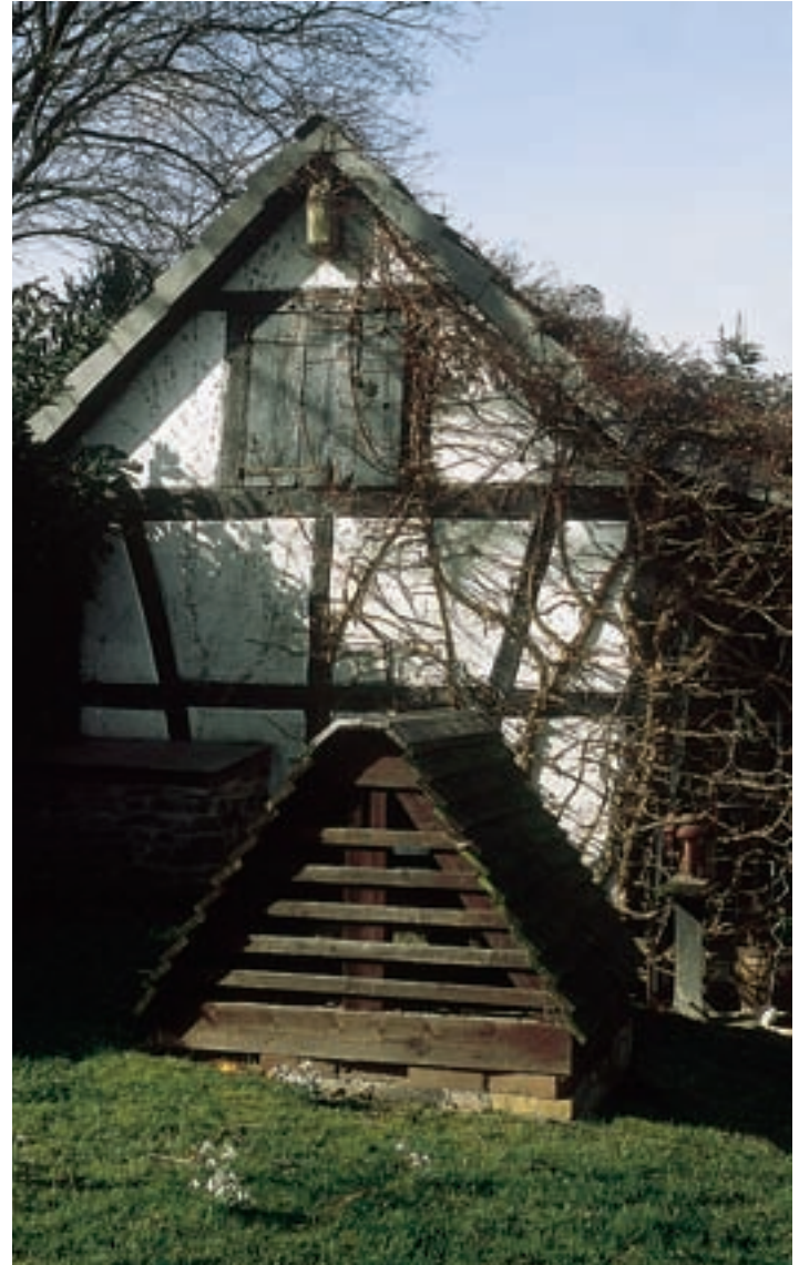
Fachwerkgebäude mit Brunnenhäuschen in Weiert

Die gesundheitliche Versorgung der Bevölkerung ist durch eine ausreichende Zahl frei praktizierender Ärzte und Fachärzte sichergestellt. Unterstützt wird dieses Angebot durch zahlreiche Physiotherapie-, Entspannungs- und Wellness-einrichtungen. Um eine geordnete Bebauung, die Schaffung von Arbeitsplätzen, die Verbesserung der Verkehrsverhältnisse und die Erhaltung der reizvollen Landschaft ist die Gemeinde bemüht.