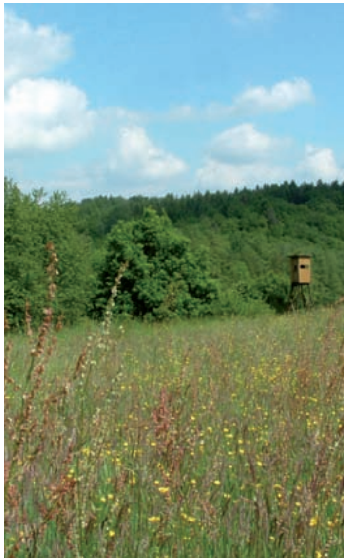
Blumenwiese im Wahnbachtal

Birkenfelder Str. 46 • 53819 Neunkirchen Tel.: 02247-9159406 • Fax: 02247-9159407 E-Mail: kontakt@garten-leben.com Internet: www.garten-leben.com