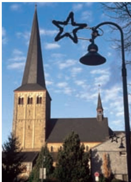
Pfarrkirche St. Margareta in Neunkirchen