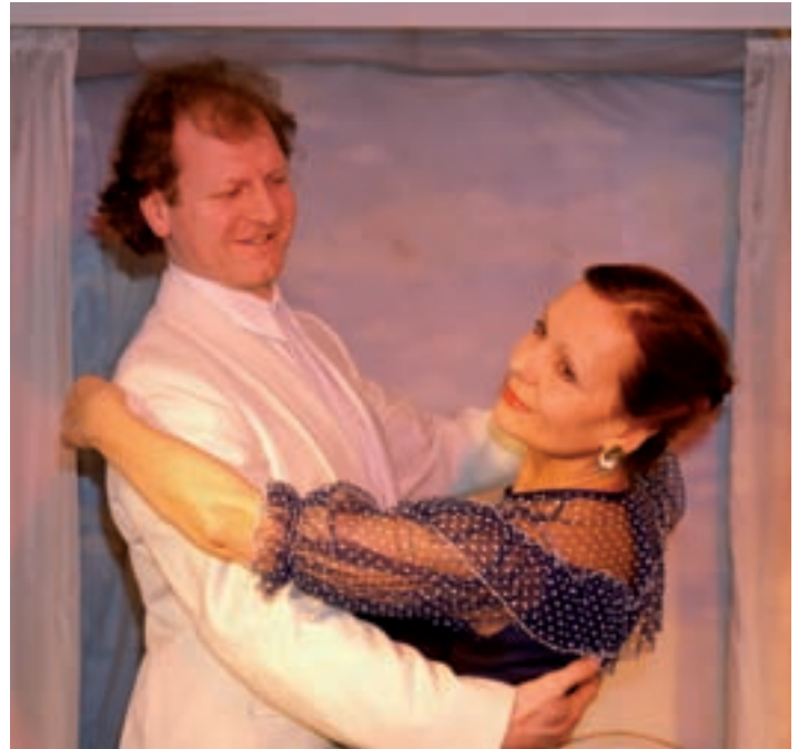
Szenenfoto aus dem Stück „Sechs Tanzstunden in sechs Wochen“ (Theater Haus Birkenried in Hohn)