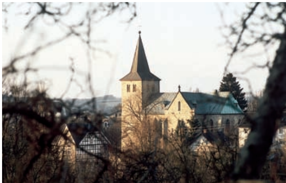
Kath. Kirche St. Georg in Seelscheid