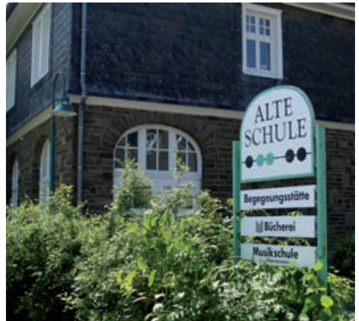
„Alte Schule“ Neunkirchen