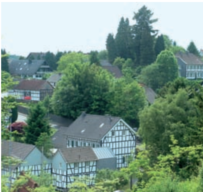
Blick auf Dorf-Seelscheid