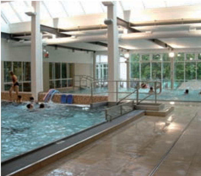
Blick auf das Vario-Becken

Die Mitgliedschaft in der AQUARENA-Schwimmhalle berechtigt zur unbegrenzten Benutzung der Schwimmhalle während der öffentlichen Badezeit.