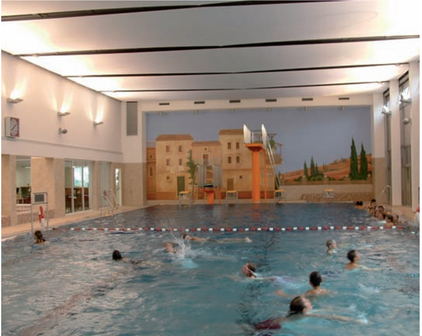
Mehrzweckbecken mit Sprunganlage