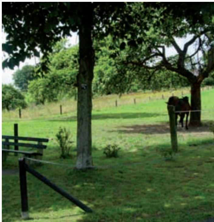
Pferdewiese zw. Seelscheid/Herster u. Schaaren

In früheren Zeiten beschränkten sie sich hauptsächlich auf die Zeith- und Köln-Siegener Landstraße. Händler und Soldaten, Räuberbanden und Deserteure, Postkutschen und die Kraftfahrzeuge der Neuzeit benutzten immer wieder diese in das Siegerland und in die naheliegenden Städte führenden Höhenstraßen. Wege und Straßen sind aber nicht nur Grundlage von Leben und Wohlstand, sondern bergen auch Gefahren für die Menschen, die an ihnen siedeln. Die