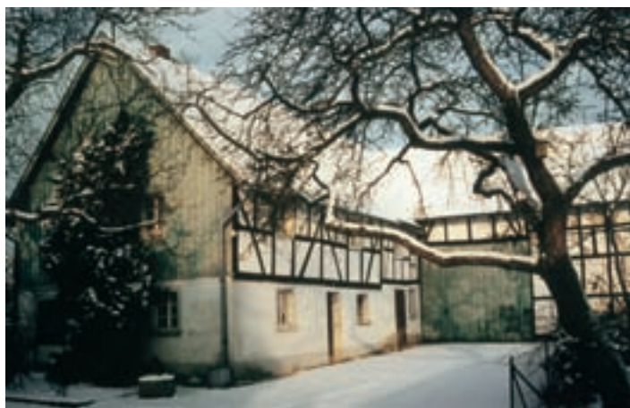
Hofanlage in Schöneshof

Für An-, Um- und Abmeldungen ist die für Neunkirchen-Seelscheid zuständige Zulassungsstelle die Kreisverwaltung Siegburg, Kaiser-Wilhelm-Platz, 53721 Siegburg, Telefon 02241 130. Abmeldungen werden auch bei der Gemeindeverwaltung, Ordnungsamt, Zimmer 114, entgegengenommen.