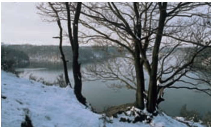
Winteridylle an der Wahnbachtalsperre