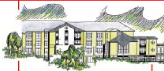
CARITASHAUS St. Elisabeth