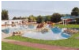
Freizeit- und Erlebnisbad