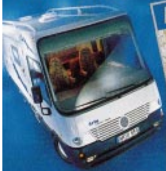
Der neue Flair