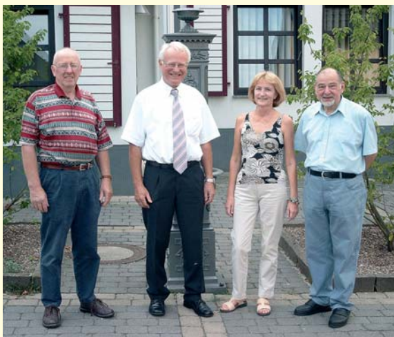
Bürgermeister und Beigeordnete vor dem Rathaus.

Betriebsrat a. D., geb. am 18. 2. 1936, verwitwet, zwei Kinder Der Betreuung der zahlreichen Ortsvereine kommt in Urmitz eine ganz besondere Bedeutung zu. Die zahlreichen Veranstaltungen der zurzeit 27 Vereine machen viel