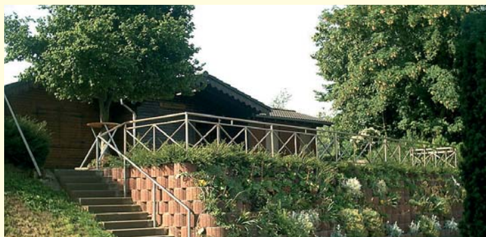
Grillhütte für bis zu 70 Personen

Neben den ortsansässigen Gastronomen kann Ihnen auch die Gemeinde Räumlichkeiten für Feiern aller Art zur Verfügung stellen!