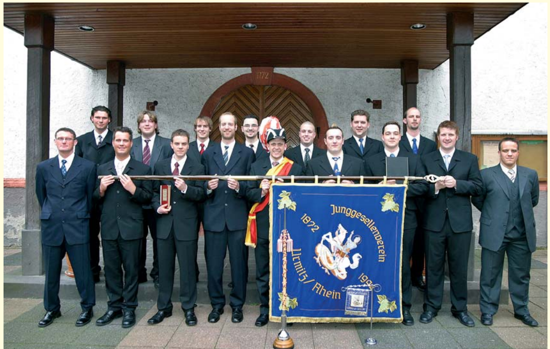
Komitee 2005 mit Junggesellenvater und Fähnerich

Das Alt-Komitee besteht ausschließlich aus ehemals aktiven Komiteemitgliedern. Nur wer zuvor im Komitee war, ist somit im Alt-Komitee.