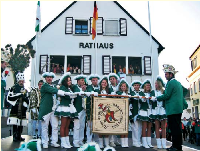
Rathausstürmung mit Vereidigung der Prinzengarde

Weitere Informationen erhalten Sie auf der umfangreichen Homepage der Karnevalsgesellschaft unter www.kg-urmitz.de