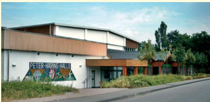
Foyer der Sporthalle (für bis zu 150 Personen).

Neben den ortsansässigen Gastronomen kann Ihnen auch die Gemeinde Räumlichkeiten für Feiern aller Art zur Verfügung stellen!