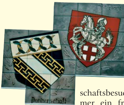
Wappen der Partnergemeinden vor dem Rathaus.

Seit 1. Mai 1981 pflegt Urmitz eine Partnerschaft mit der französischen Gemeinde Les Noes bei Troyes in der Champagne. Seither werden regelmäßig gegenseitige Freundschaftsbesuche durchgeführt, die immer ein freudiges Erlebnis für alle Beteiligten sind. Die Unterbringung in Les Noes und Urmitz erfolgt grundsätzlich bei Gastfamilien. In Verbin-