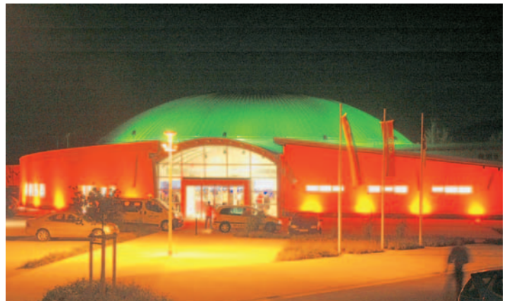
Kulturhalle bei Nacht