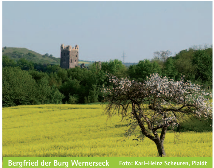
Bergfried der Burg Werneseck

Die erfolgreiche Dorferneuerung und die Ausweisung und Realisierung großer Wohn- und Gewerbegebiete, sowie der Bau des Jakob-Vogt-Stadions (2003) und der Kulturhalle Ochtendung (2006) haben Ochtendung in eine moderne und attraktive Gemeinde verwandelt, die heute rund 5.400 Einwohner zählt.