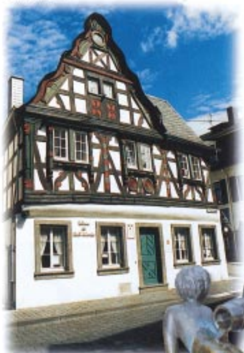
Rathaus der Stadt Vallendar