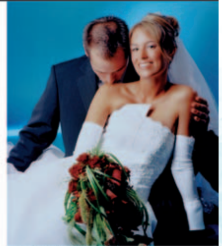
150 qm großes Portraitstudio