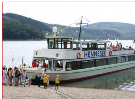
Fäherschiff „MS Hennessee“