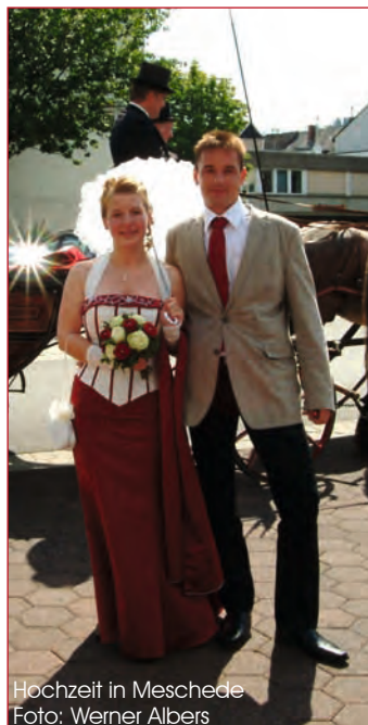
Hochzeit in Meschede