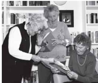
St. Katharinen- und Weißfrauenstift Stiftung des öffentlichen Rechts

„Gestärkt durch Tradition stellen wir uns den Aufgaben unserer Zeit und den Herausforderungen der Zukunft“