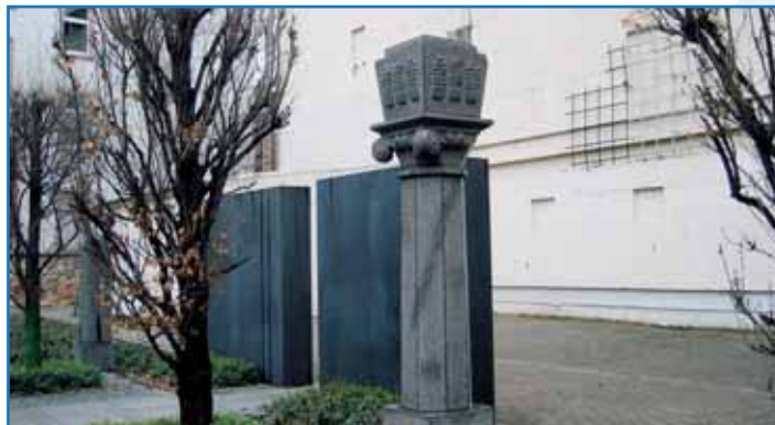
Gedenkstätte ehem. Synagoge Friedberger Anlage

Quirligkeit und Geschäftigkeit allenthalben in dem Ort, der bei der Eingemeindung im Jahr 1877 einer der reichsten rund um Frankfurt war. So ist samstags ohne Frage der Markt mit seinem Uhrtürmchen der Mittelpunkt des Stadtteillebens. Nicht zu vergessen im gefüllten Veranstaltungskalender ist die „Dippemess“. Ursprünglich war sie ein Markt für Töpfe, heute ist sie als größter Frankfurter Jahrmarkt in aller Munde und findet zweimal im Jahr statt. Die Fühjahrs-Dippemess hat ihre Tore im April drei Wochen lang für Besucher geöffnet, während die Herbst-Dippemess noch einmal im September eine Woche lang mit zahlreichen Vergnügungen für jede Altersgruppe aufwartet. Historische Gasthäuser mit Frankfurter Spezialitäten und ein altes Rathaus laden zu Handkäs mit Musigg ein, und wer sich danach wieder fit trainieren