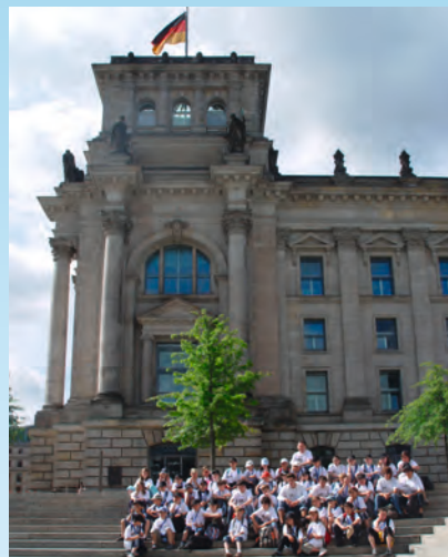
Das Kinder- und Jugendforum beim Besuch des Bundestages in Berlin mit den Vertretern des Kinderparlaments aus der Partnerstadt St. Egrève

Das Kinder- und Jugendforum hat seit 1999 Tradition in Karben. Alle zwei Jahre wählen die Kinder und Jugendlichen ihre Vertreter neu. In jedem der sieben Karbener Stadtteile finden Wahlen statt. Aus jedem Stadtteil werden drei Kinder und Jugendliche in das Forum entsandt. Im Forum haben die Kinder und Jugendlichen die Möglichkeit, ihre Probleme im Stadtteil an die Verwaltung weiterzugeben. Die Verwaltung berichtet in der folgenden Sitzung über die einzelnen Punkte. Ferner werden stadtteilübergreifende Themen angesprochen, wie zum Beispiel aktuell die