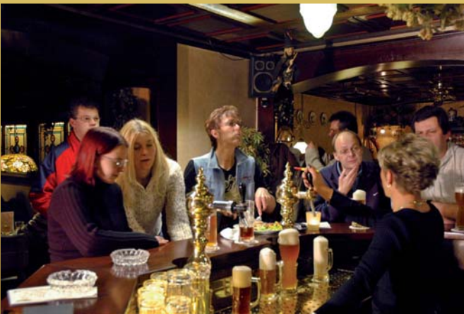
Brauhaus Schluckebier · Bad Nauheim Rittershausstraße 5, Nähe Thermalbad