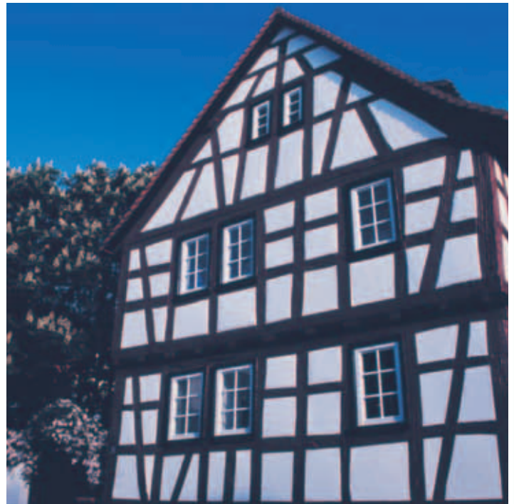
Haus in der Schulstraße

Vereinzelte Konstruktionsmerkmale im weitgehend ungestörten Fachwerkverband datieren die Entstehung des ältesten erhaltenen Egelsbacher Bauernhauses, eines Hakenhofes, in der Schulstraße 28, noch bis ins 17. Jahrhundert. Dafür spre-