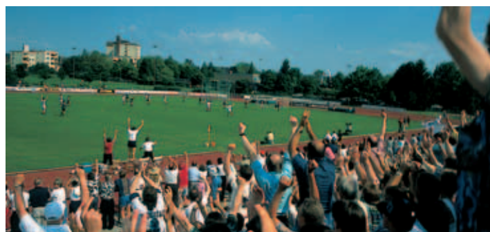
Sportanlage am Berliner Platz

zügigen Dusch- und Umkleieräumen sowie einer ausfahrbaren Tribüne und eine Schulsporthalle zur Verfügung.