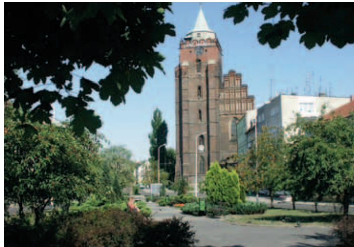
Marktplatz in Chojnów