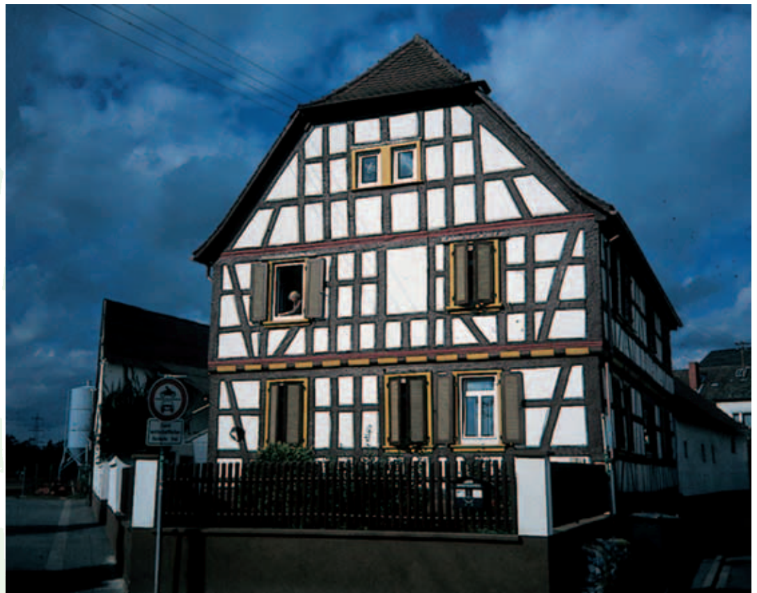
Langener Straße 20

Ein anders gestaltetes Siegel ist aus dem Jahre 1708 überliefert. Hier erwächst ein Eichbaum mit 3 Eicheln