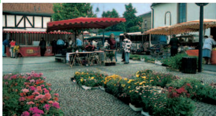
Markt auf dem Kirchplatz