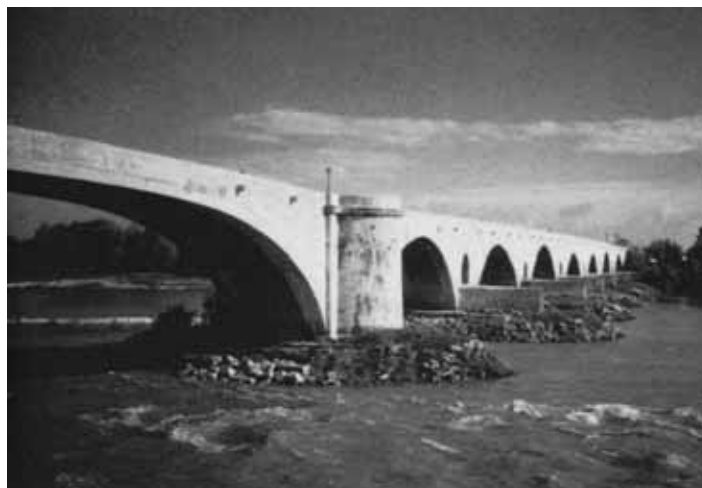
Die Brücke, die Pont-Saint-Espirit den Namen gab

Den Besucher erwarten in Pont-Saint-Espirit am Tor zur Provence die Zeugen einer zweitausendjährigen Geschichte: die Brücke (13. Jh.), die Zitadelle, die Stiftskirche (15. Jh.), das Königshaus (16. Jh.), der St.-Peter-Platz, Saint Saturnin und die Prieurei des Hl. Petrus, die Kapelle Penitents Bleus, das Museum Paul Raymond, das Ritterhaus (12. Jh.), ältestes