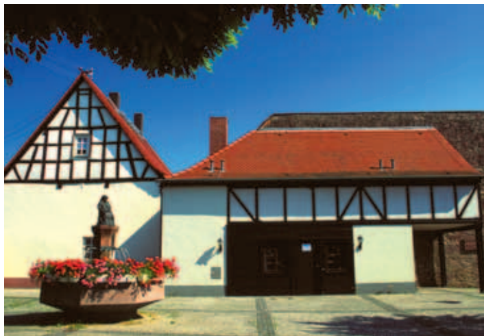
Clammerschnitzerbrunnen am Wachthaus (Arresthaus)