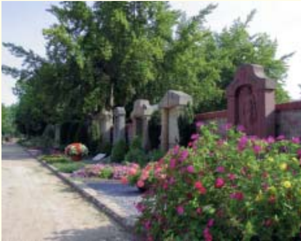
Jugendstilgrabsteine des Griesheimer Bildhauers Daniel Dell

Bei einem Trauerfall müssen die Hinterbliebenen verschiedenartige Aufgaben kurzfristig wahrnehmen und Entscheidungen von einem Moment auf den anderen treffen, obwohl man sich in einer Extremsituation befindet, die vom Schmerz über den Verlust eines nahe stehenden Menschen dominiert wird.