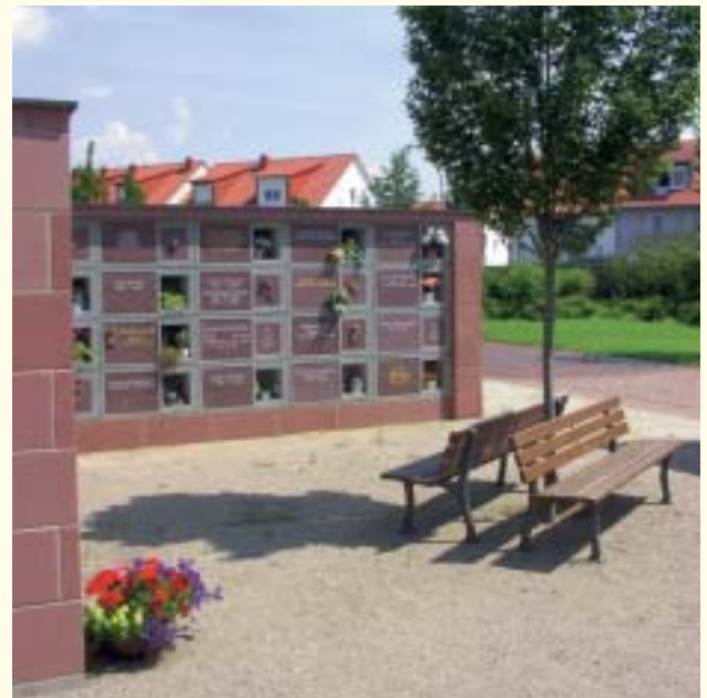
Urnenhain im neuen Friedhofsteil

Helfen Sie Ihrem Partner, Ihren Kindern oder auch anderen Nahestehenden, diese Extremsituation zu meistern – in Ihrem Sinne. Nicht nur, indem Sie Familienmitglieder und Freunde frühzeitig darauf aufmerksam machen, wo die entsprechenden Unterlagen im Ernstfall zu finden sind, sondern auch, welche Vorstellungen Sie selbst von Ihrem Fortgehen haben, wie Formalitäten in Ihrem Sinne geregelt werden sollen, welche Wünsche Sie für Ihre Hinterbliebenen und für das Andenken an Sie selbst haben.