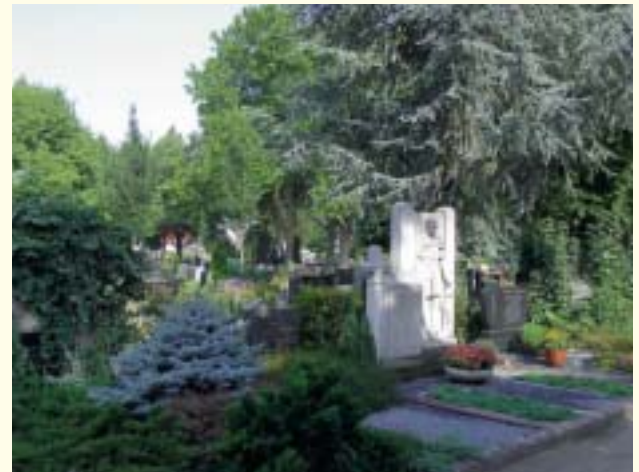
Friedhofsansicht im Grünen

Die Anlage und die Unterhaltung von Ehrengabstätten, ob einzeln oder in geschlossenen Feldern, obliegt ausschließlich der Stadt Griesheim.