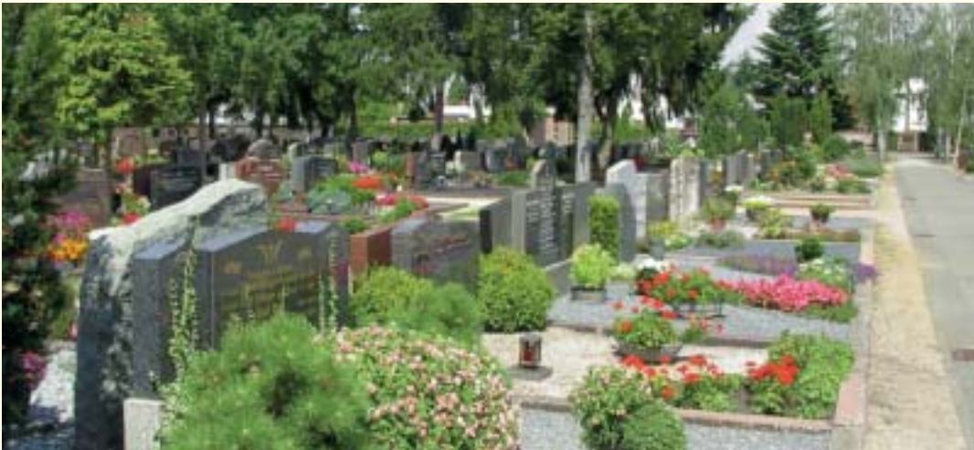
Friedhofsansicht mit Blick auf das Kreuz

Das Wort „Friedhof“ bezeichnete früher einen eingefriedeten Raum um eine Kirche, in dem Verfolgte Schutz – also „Frieden“ – fanden. Heute ist er eine Stätte des Gedenkens und der Erinnerung, aber auch ein Treffpunkt für die Bevölkerung der Stadt, ein Teil der Kulturgeschichte einer Region, ja, ein Teil Stadtgeschichte, geben doch die Gestaltung von Denkmälern, Grabsteinen und Inschriften ortsbekannter Persönlichkeiten davon Zeugnis.