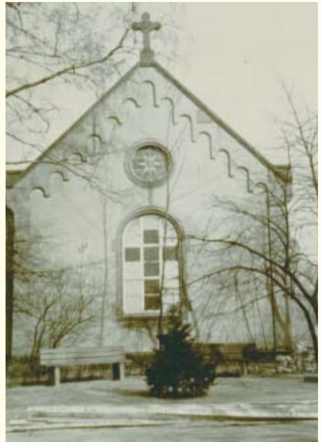
Ehemalige Trauerhalle (1964 abgerissen)

Der Sterbefall ist durch die Hinterbliebenen persönlich oder durch einen beauftragten Bestattungsunternehmer beim Standesamt anzuzeigen. Hierbei ist auch die vom Arzt ausgestellte Todesbescheinigung vorzulegen.