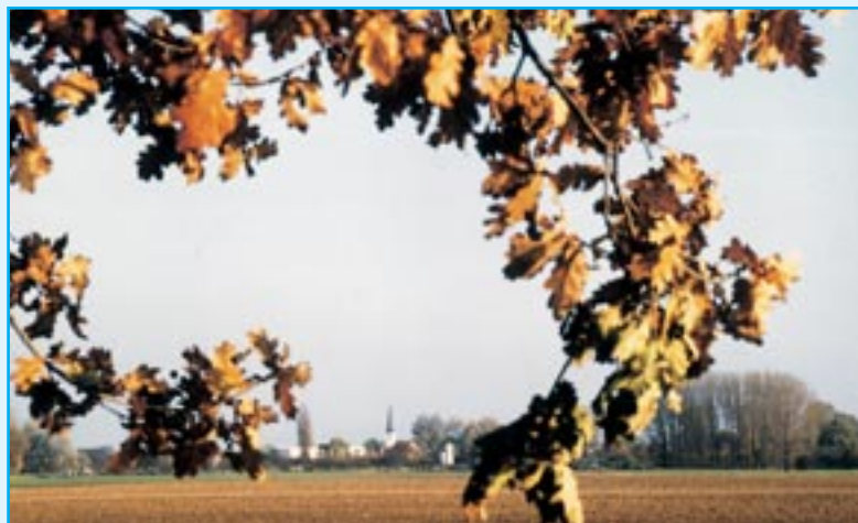
Riedlandschaft mit Blick auf Stockstadt am Rhein