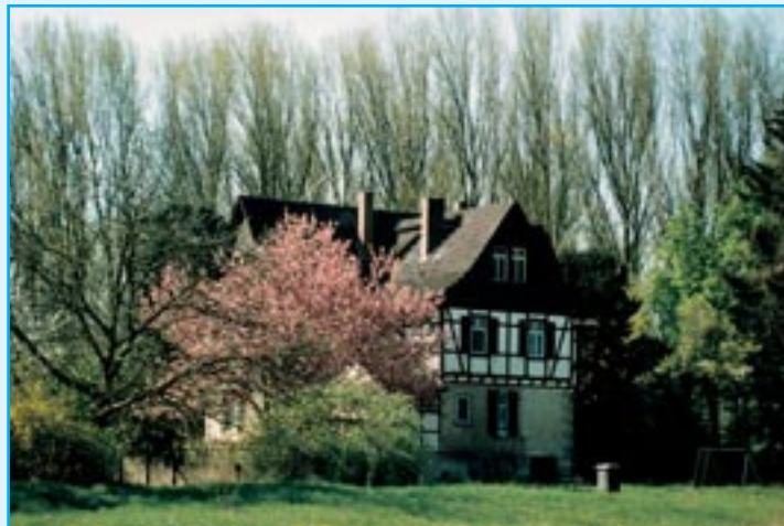
Ehemaliges Forsthaus auf dem Kuhkopf