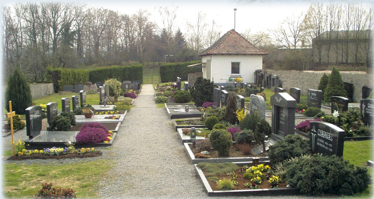
MITTERSHAUSEN 1.360 QM