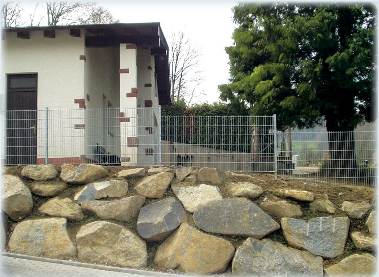
OBER-LAUDENBACH 2.940 QM

DORT WERDEN AUCH AUSKÜNFTEN ÜBER DIE VERSCHIEDENEN BESTATTUNGS- UND GRABARTEN (REIHEN-, FAMILIEN- ODER URNENGRAB) SOWIE GESTALTUNG VON GRABMÄLERN UND GRABEINFASSUNGEN ERTEILT. AUCH BEZÜGLICH DER HÖHE DER VON DER BESTATTUNGSFORM ABHÄNGIGEN FRIEDHOFSGEBÜHREN KANN AUF WUNSCH AUSKUNFT GEGEBEN WERDEN.