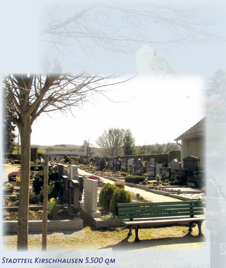
STADTTEIL KIRSCHHAUSEN 5.500 QM