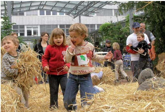
Spaß für Kinder auf dem Löwenplatz

Rüsselsheim hat auch für die Freizeit viel zu bieten. Der spätromantische Verna-Park, der großzügige Ostpark, das Mainvorland oder der Horlachgraben und große Waldgebiete dienen der Naherholung. Die überregional verlaufende Regionalparkroute lädt zum Erkunden des Rhein-Main-Gebiets auf Rad- und Wanderwegen ein. Neben dem Freizeit- und Erlebnisbad „An der Lache“ gibt es hervorragende Sportstätten und rund 80 Sportvereine, in denen fast jede Sportart ausgeübt werden kann. Dadurch ist der Breiten- und Spitzensport in Rüsselsheim zuhause. Auch bei Olympischen Spielen kämpften bereits Rüsselsheimer Sportlerinnen und Sportler um Medaillen. Zahlreiche sportliche und kulturelle Veranstaltungen prägen das Jahresgeschehen in der Stadt. Höhepunkte im Festkalender sind