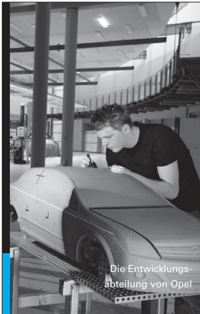
Die Entwicklungs- abteilung von Opel

in der Schillerschule Träger: Förderverein der Schillerschule e.V. Nackensteiner Straße 2 1/10, Telefon: 6 59 18