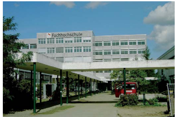
Fachhochschule Wiesbaden, Campus Rüsselsheim