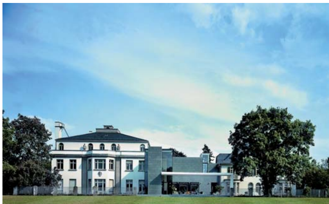
Opelvillen Rüsselsheim: Zentrum für Kunst

Im Obergeschoss der stilgerecht renovierten Villa Wenske (1916) steht für alle Heiratswilligen ein Hochzeitszimmer mit ausgesprochen schöner Atmosphäre zur Verfügung. Für die Anmeldung Ihrer Hochzeit in der Villa Wenske und weitere Informationen wenden Sie sich bitte an: Standesamt, Marktplatz 4, 65428 Rüsselsheim Telefon: 06142/ 83-27 26 E-Mail: standesamt@ruesselsheim.de