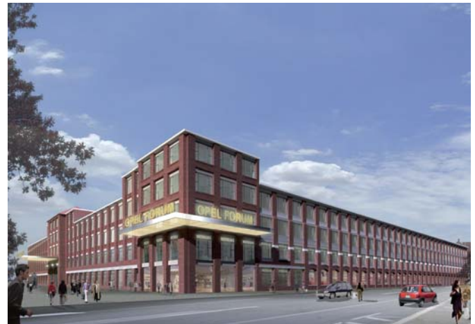
Automobile Erlebniswelt im Opel Forum

Eine der bedeutendsten Maßnahmen von Rüsselsheim 2020 ist die Wiederbelebung des Opel-Altwerks mitten in der Innenstadt und direkt am Bahnhof. Die Adam Opel GmbH hat Teile des Altwerks an eine Investorengruppe veräußert. Wo einst hinter Backsteinfassaden in Handarbeit Autos hergestellt wurden, soll bis 2011 das Opel Forum Rüsselsheim mit einer automobilen Erlebniswelt entstehen. Künftig soll es möglich sein, in die Geschichte der Automobile einzutauchen und mehrere hundert liebevoll restaurierte Oldtimer zu erleben. Außerdem gibt es dort zusätzliche Einkaufsmöglichkeiten für Kleidungstrends, Unterhaltungselektronik oder Geschenkideen, sodass sich die Innenstadt mit einem modernen Einkaufsangebot präsentiert. Wer nach einem Einkaufsbummel oder Besuch der Oldtimer-Ausstellungen neue Kraft schöpfen will, kann sich in dem Gastronomiebereich des Opel Forums oder der Innenstadt erholen.