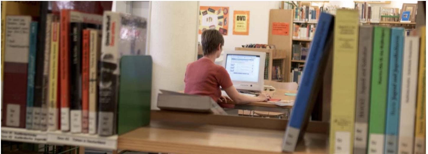
Stadtbücherei Am Treff

Leseförderung ist eine wichtige Aufgabe der Stadtbücherei.