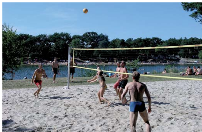
Beachvolleyball im Waldschwimmbad

Sozialamt, Abteilung Wohnen Mainstraße 7 83-28 74