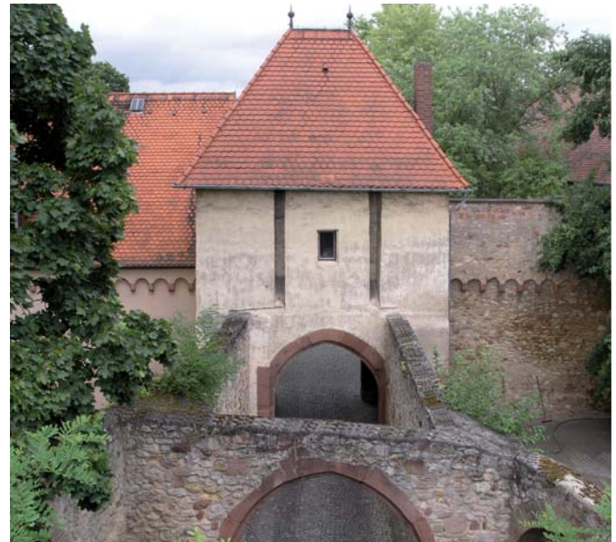
Festung Rüsselsheim: über 600 Jahre alt