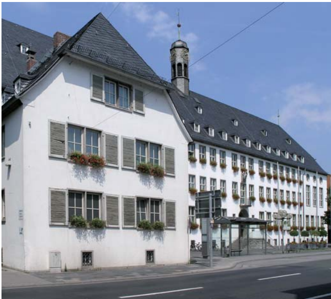
Rathaus am Marktplatz