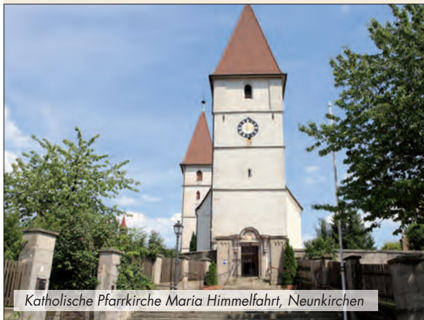
Katholische Pfarrkirche Maria Himmelfahrt, Neunkirchen

Der zentralen Lage an der bereits 1061 genannten alten böhmischen Straße, die Eger mit Nürnberg verband, und der Eisenstraße, die von Regensburg kam und über Eschenau weiter nach Bamberg führte, verdankte die Neunkirchener Pfarrei sicher ihre Entwicklung mit. Vom Neunkirchener Kirchensprengel wurde bereits frühzeitig Kirchrötenbach abgetrennt und erhielt eine eigene Pfarrei. 1375 bekam Lauf eine eigene Pfarrei, 1539 Reichenschwand und 1840 Kersbach, um nur einige Orte zu erwähnen, die zum Pfarramt Neunkirchen gehörten. Vom ältesten Kirchenbau aus römischer Zeit haben sich keine Spuren erhalten. Der heutige Bau reicht in seinem Kern bis in das 14. Jahrhundert zurück. Die beiden Stützpfiler, außen an der Südmauer des Chors, wurden noch in gotischer Zeit errichtet. Das von einer Mauer umgebene Gebiet der Kirche samt Pfarrhof und Friedhof war eine Freieigenschaft mit Asylrecht, die noch im späten 17. Jahrhundert strengstens respektiert wurde.