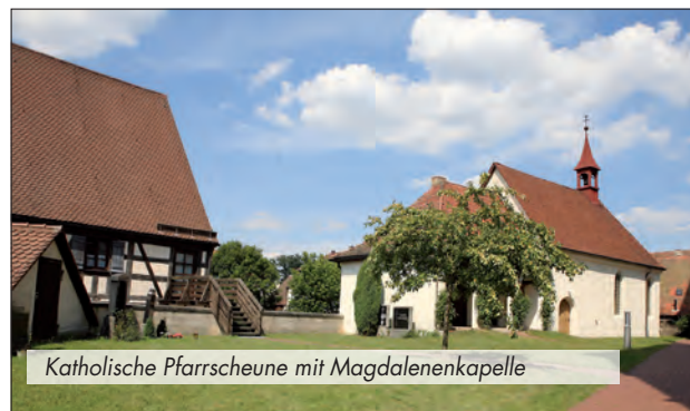
Katholische Pfarrscheune mit Magdalenenkapelle