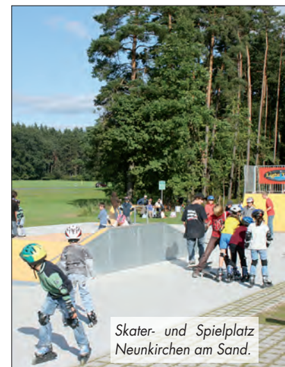
Skater- und Spielplatz Neunkirchen am Sand.

und Jugendlichen angenommen. Dieser Spiel- und Skaterplatz lässt kaum noch Wünsche offen. Eine Schaukel und eine Wippe, eine lange Rutsche, ein Klettergerüst und ein Sandkasten laden zum Spielen und Spaßhaben ein. Aber auch durch den Umgang mit der Natur und die für die Kinder bereitgestellten Materialien erfahren sie, wie die Welt beschaffen ist. Sie finden sie sich langsam, aber sicher immer besser in ihrer Umwelt zurecht und werden immer selbstständiger. Außerdem entwickeln Kinder beim Spielen ihre Fähigkeiten und Talente, setzen Kreativität und Fantasie frei und lernen den Umgang mit anderen, denn Kinder spielen ja nicht nur allein, sondern auch viel mit anderen, zumal auf einem Spielplatz. Hier finden sie, was ihr Herz begehrt und was ihrer Entwicklungsstufe entspricht.