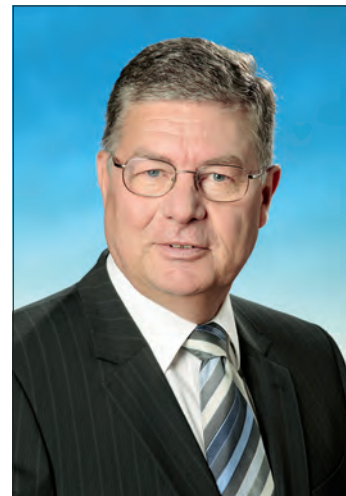
Kurt Sägmüller 1. Bürgermeister