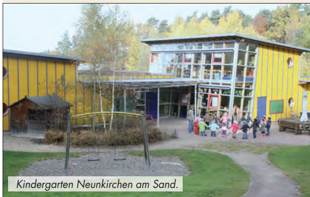
Kindergarten Neunkirchen am Sand.