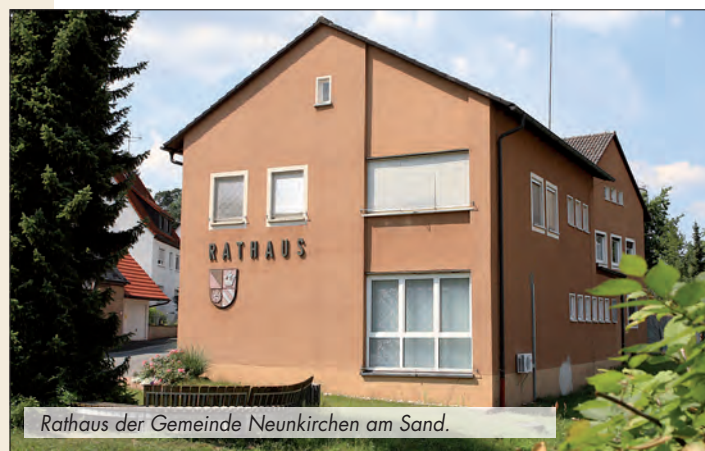
Rathaus der Gemeinde Neunkirchen am Sand.