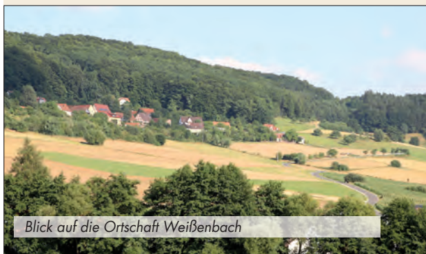
Blick auf die Ortschaft Weißenbach