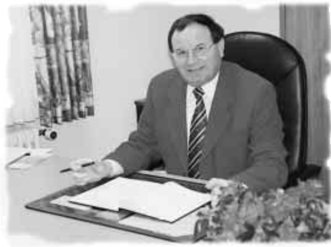
Hartmut Grimm Bürgermeister der Verbandsgemeinde Thaleischweiler-Fröschen