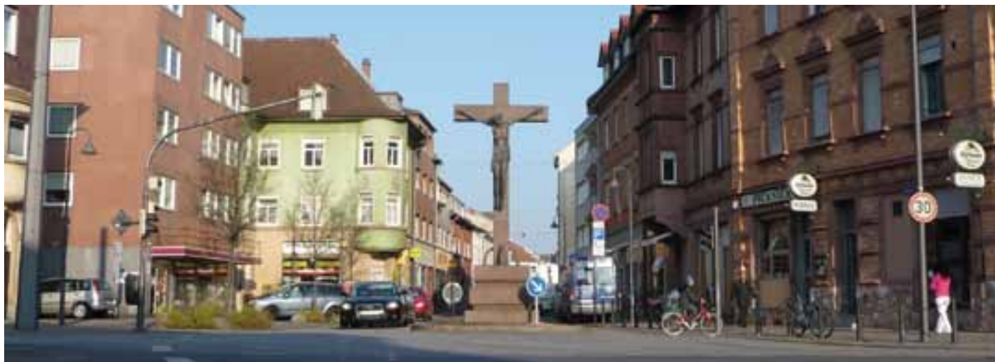
Großes Kreuz Mundenheim