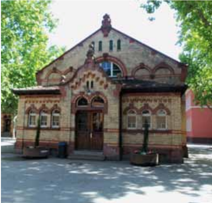
Alte Turnhalle Schillerschule Mundenheim