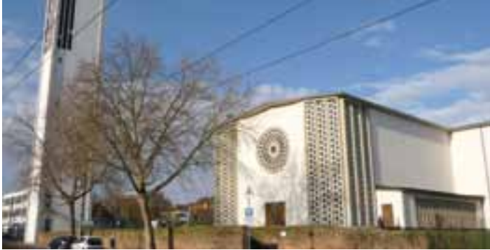
Katholische Pfarrkirche St. Sebastian

Katholische Pfarrkirche St. Sebastian Zedtwitzstraße 2 · 67065 Ludwigshafen Telefon: 0621 579290-0