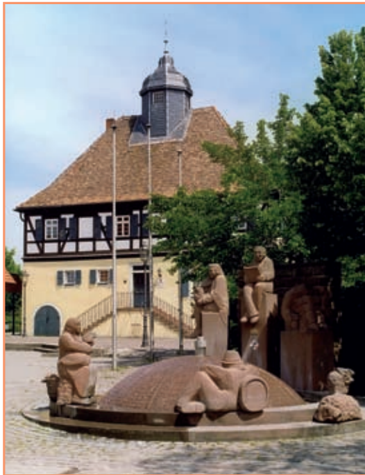
Schloss in Ruchheim

Auch Trauzeugen sind nicht mehr notwendig, können aber auf Wunsch gern mitgebracht werden.