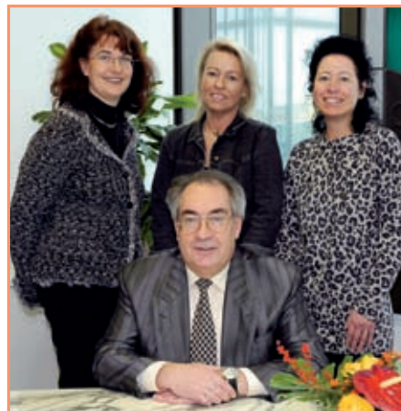
Ihr Team vom Standesamt