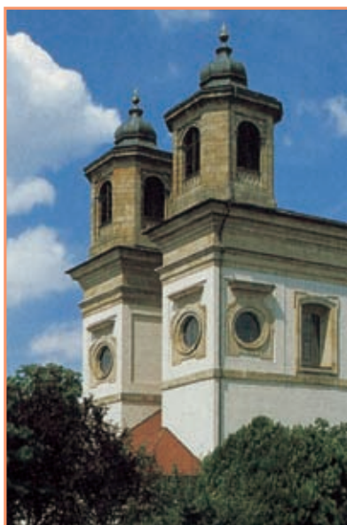
Wallfahrtskirche Maria Himmelfahrt in Oggersheim

Die römisch-katholische Kirche versteht die Ehe als ein Sakrament, das die Eheleute einander spenden. Die Festgemeinde bittet Gott mit Liedern, Fürbitten und Gebeten darum, das Paar zu segnen. Das Ehesakrament kann nur einmal gespendet werden und setzt die lebenslange Treue voraus. Deshalb müssen