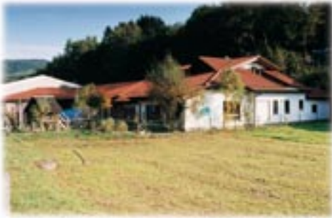
Kommunaler Kindergarten Fischbach