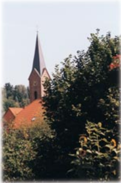
Protestantische Kirche Hochspeyer