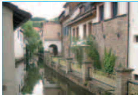
Stadterneuerung „Mühlgasse“ Wolfstein