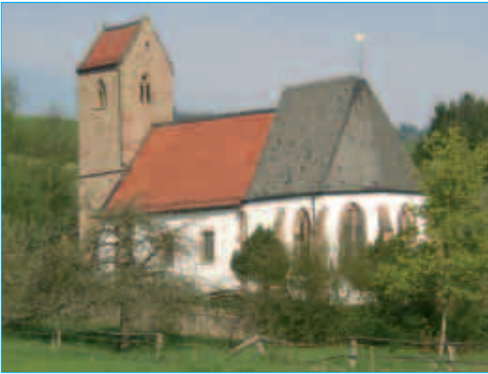
Historische Zweikirche zwischen Rutsweiler/Lauter und Wolfstein

Die Zweikirche im Lautertal gehört zu den ältesten Kirchen der Pfalz. Das Gotteshaus wurde neben einer aus fränkischer Zeit stammenden St.-Peterskirche erbaut. Die Zweikirche war gemeinsame Pfarrkirche mit Begräbnisplatz des ehemaligen Dorfes Allweiler (bereits im 14. Jahrhundert untergegangen), des Dorfes Rutsweiler, der verschwundenen Siedlungen Oberhausen und Laufhausen sowie des späteren „Höfgen zu Zweinkirchen“.