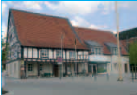
Dorfplatz Nußbach, mit Fachwerkhaus