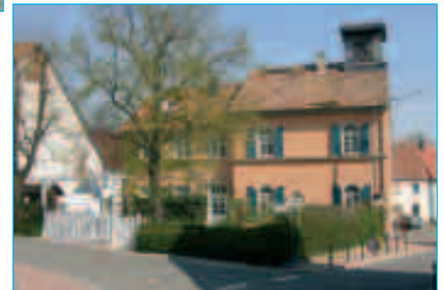
Ehemaliges Schulhaus Oberweiler i. Tal