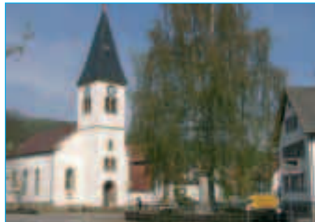
Ev. Kirche Eßweiler