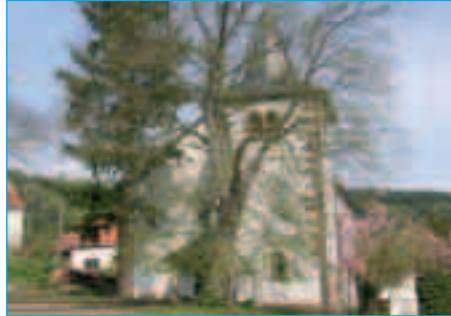
Ev. Kirche Hinzweiler