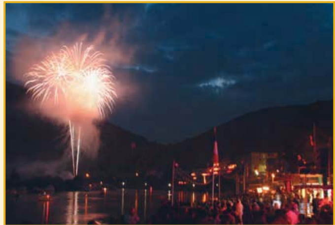
»Tag des Gastes«