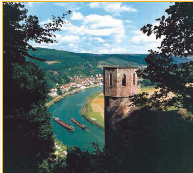
Blick vom »Schwalbennest« auf Neckarsteinach