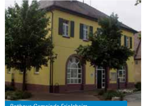
Rathaus Gemeinde Friolzheim

Mo. + Do.: 08.00 – 16.30 Uhr Di.: nicht geöffnet Mi.: 08.00 – 12.00 und 15.00 – 18.00 Uhr Fr.: 08.00 – 16.00 Uhr