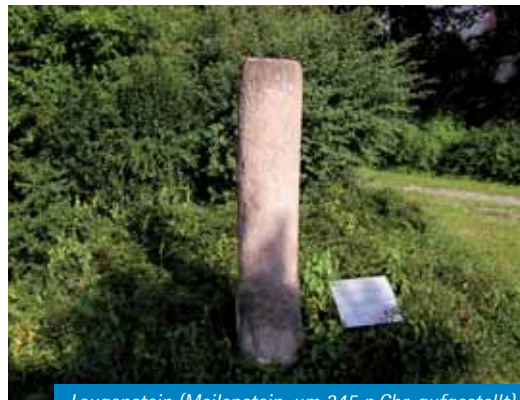
Leugenstein (Meilenstein, um 245 n.Chr. aufgestellt)

Bei einem Großbrand am 19.08.1895 brannten während der Erntezeit mitten im Dorf 12 Häuser vom Gasthaus „Löwen“ bis zur heutigen Metzgerei in der Kirchstraße nieder.