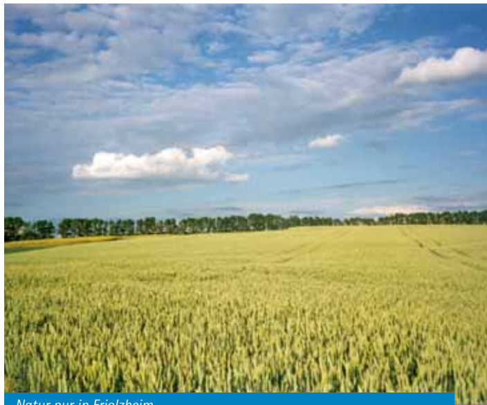
Natur pur in Friolzheim...