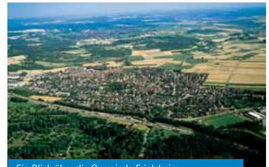
Ein Blick über die Gemeinde Friolzheim

Friolzheim liegt in der Region Nordschwarzwald am östlichen Rand des Enzkreises, und gehört somit zur Metropolregion Stuttgart. Inmitten der Landschaft des Heckengäu ist Friolzheim verkehrsgünstig direkt an der Bundesautobahn A8 gelegen (1,5 km zur Ausfahrt Heimsheim). Die Städte Pforzheim in der Region Nordschwarzwald sowie Leonberg in der Region Stuttgart sind mittels PKW über die Autobahn oder durch die guten öffentlichen Nahverkehrsverbindungen schnell erreicht.