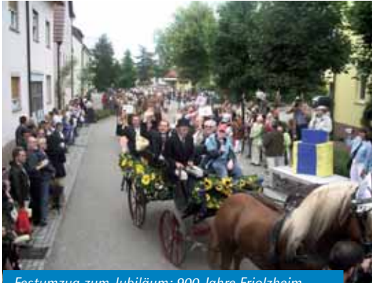
Festumzug zum Jubiläum: 900 Jahre Friolzheim

Das rasante Wachstum der Gemeinde brachte jedoch auch immer wieder die dringende Notwendigkeit zur Erweiterung vorhandener bzw. Schaffung neuer öffentlicher Einrichtungen. So wurde im Jahr 1993 der Trinkwasserbrunnen „Eichbrunnen“ sowie der Wasserhochbehälter am Geissberg in Betrieb genommen.