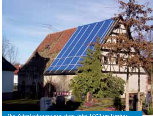
Die Zehntscheune aus dem Jahr 1563 im Umbau

Das Jahr 2005 stand ganz im Zeichen des 900jährigen Jubiläums der urkundlichen Ersterwähnung Friolzheims. Mit verschiedenen Veranstaltungen wurde das ganze Jahr über das Bestehen der Gemeinde gefeiert. Das „Schwester-Karoline-Haus“ wurde 2008 fertiggestellt und bietet seither 48 Pflegeplätze für pflegebedürftige Menschen und 19 betreute Seniorenwohnungen. Außerdem ist der Umbau der im Jahre 1563 erbauten Zehntscheune