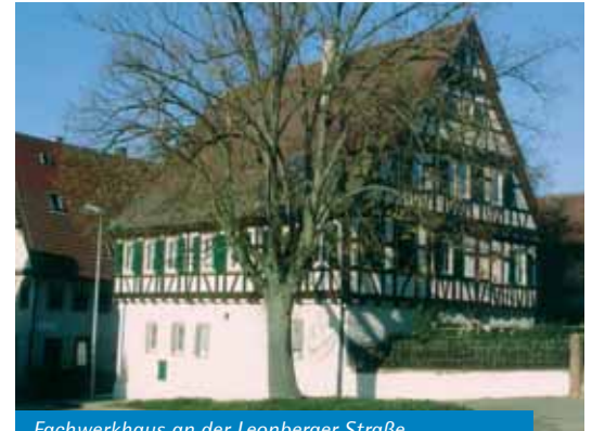
Fachwerkhaus an der Leonberger Straße

terwohngemeinde bei, die sich bis zum Jahr 1950 auf 936 Einwohner erweiterte. Veränderungen haben sich für die Gemeinde auch durch die auf 01.01.1973 vollzogene Kreisreform ergeben. Durch Landesgesetz wurde – entgegen einem eindeutigen Bürgervotum – der Kreis Leonberg aufgelöst und die Gemeinde Friolzheim, zusammen mit der Stadt Heimsheim und der Gemeinden Mönshheim und Wimsheim, dem neu gebildeten Enzkreis mit Sitz in Pforzheim zugeschlagen. Die Gemeinde Friolzheim gehört seit diesem Zeitpunkt zum Regierungsbezirk Karlsruhe und zur Region Nordschwarzwald.