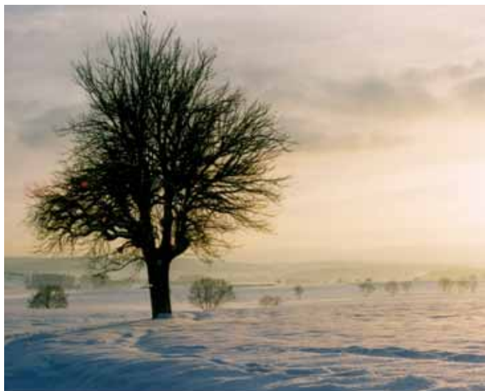
...auch im Winter