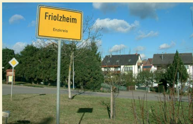
Willkommen in Friolzheim!