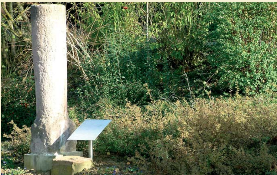
Um 245 n. Chr. aufgestellt: Meilenstein (Leugenstein)