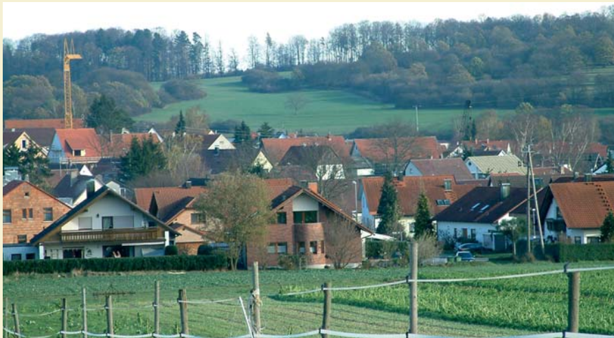
Blick über die Lüsse auf den Betzenbuckel

Unter anderem wurden die Neubaugebiete „Lehen I-V“, „Birkbusch“, „Brühl“ und „Feld“ erschlossen und bebaut. Eine wesentliche Erweiterung der Gemeinde, die im Jahr 1961 1200 Einwohner und im Jahr 1971 2.023 Einwohner zählte, ergab sich durch eine große Erschließungsmaßnahme im Gewann „Schelmenäcker“. In verschiedenen Bauabschnitten wurden dort von der Wohnungsbaugesellschaft EIWOBAU in großem Ausmaß Einfamilien-, Reihenbungalows und Einfamilien-Reihenhäuser erstellt. In diesem Gebiet haben auch die ev. Kirchengemeinde und die kath. Kirchengemeinde mit einem kirchlichen Zentrum Platz gefunden. Die Jahre ab 1975 brachten die Baulandumlegung, Erschließung und Bebauung des Baugebietes „Wengert“ mit ca. 75 Bauplätzen. Dadurch war es möglich, dass wiederum eine größere Anzahl von Personen von auswärts zuziehen und in unserer Gemeinde eine neue Heimat finden konnten. Die teilweise Erschließung des Baugebietes „Lüsse“ wurde im Jahre 1985 durchgeführt.