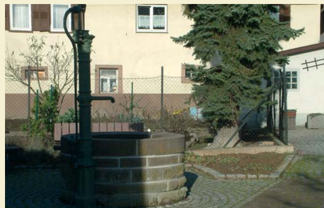
Brunnen in der Ortsmitte