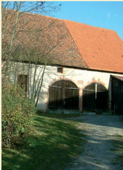
Zehntscheune aus dem Jahr 1563

Veränderungen haben sich für die Gemeinde auch durch die auf 01.01.1973 vollzogene Kreisreform ergeben. Durch Landesgesetz wurde - entgegen einem eindeutigen Bürger votum - der Kreis Leonberg aufgelöst und die Gemeinde Friolzheim, zusammen mit der Stadt Heimsheim und der Gemeinden Mönshheim und Wimsheim, dem neu gebildeten Enzkreis mit Sitz in Pforzheim zugeschlagen. Die Gemeinde Friolzheim gehört seit diesem Zeitpunkt zum Regierungsbezirk Karlsruhe und zur Region Nordschwarzwald. Die Umkreisung hatte zur Folge, dass manch alte gewohnten Behörden gänge in andere Richtungen gelenkt werden mussten. Die vom Land Baden-Württemberg auf 1.1.1975 beschlossene Gemeindereform hat für Friolzheim zwar nicht - wie für viele andere Gemeinden - den Verlust der Selbstständigkeit gebracht, doch hat sich die damals 2389 Einwohner zählende Gemeinde bereits am 21. 06. 1974 mit der Stadt Heimsheim und den Gemeinden Mönshheim, Wiernsheim und Wimsheim zu der heute fast 20.000 Einwohner umfassenden Verwaltungsgemeinschaft „Heckengäu“ zusammengeschlossen, dem durch Landesgesetz vom 09.