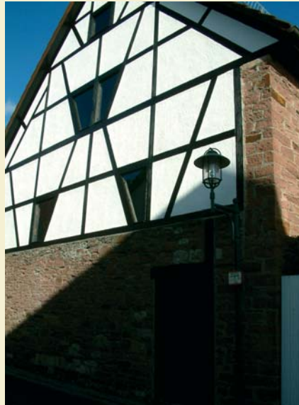
Fachwerk in der Paulinenstraße

Die Alemannen, die nach der Vertreibung der Römer Mitte des 2. Jahrhunderts n. Ohr in