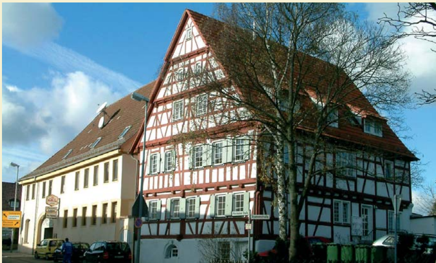
Altes im neuen Glanz

Unverändert bleiben wird jedoch der Blick vom Betzenbuckel oder Geissberg über das sich zunehmend vergrößernde Dorf zu den Hängen des nahen Schwarzwaldes, den auch der in der Fremde lebende Friolzheimer immer in sich tragen wird.