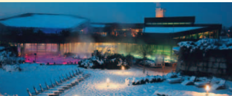
Panorama Therme im Winter

Auch die dann letzte Sprosse zum Erreichen des Titels „Bad Beuren“, die Ansiedlung eines Kurhotels, wird von den Verantwortlichen der Gemeinde Beuren schon jahrelang vorbereitet, so dass ein zukünftiger Investor offene Türen vorfinden wird.