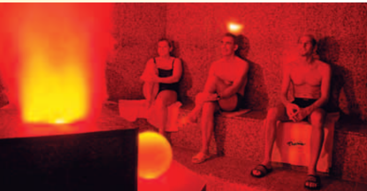
Panorama Therme – Innenbereich

nächste, groß angelegte Erweiterung im Jahr 1999 aufgefungen werden sollte.