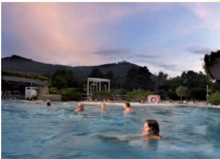
Panorama Therme – Außenbereich

Mit dieser Erweiterung stiegen die Besucherzahlen, die in den Jahren 1980 bis 1985 auf knapp 400 000 Besucher im Jahr gesunken waren, auf 500 000 Bade- und Saunagäste an. Dies führte in einzelnen Bereichen der Therme zu Überlastungen, die durch die