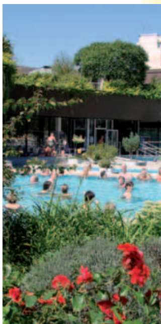
Panorama Therme Nebelhöhle und Außenbereich