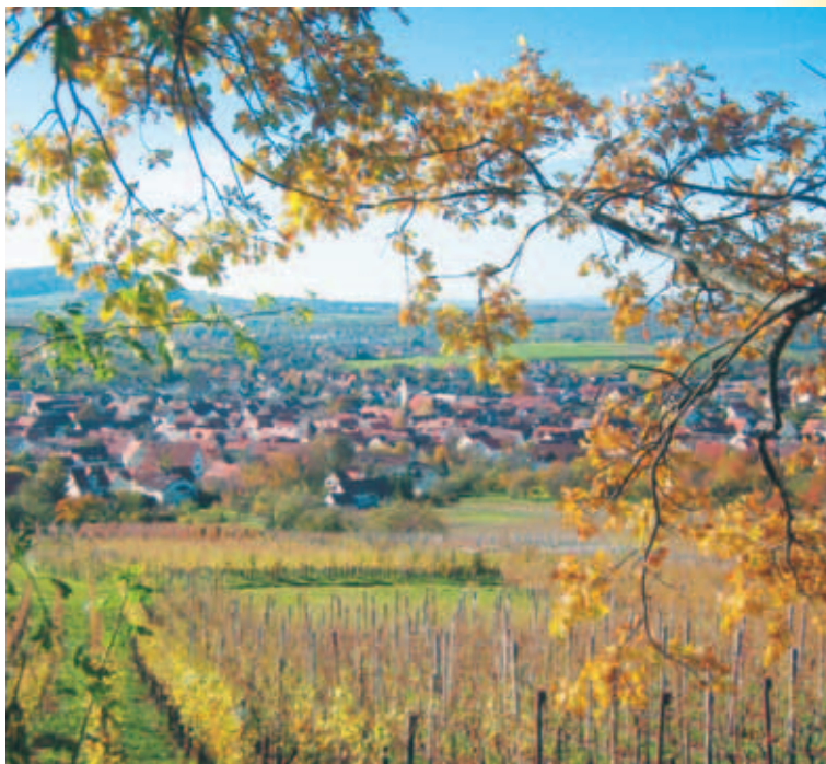
Beuren – Herbstimpressionen

NALDO: Verkehrsverbund Neckar-Alb-Donau GmbH (Linie 199 – Buslinie Beuren – Neuffen – Kohlberg – Metzingen)