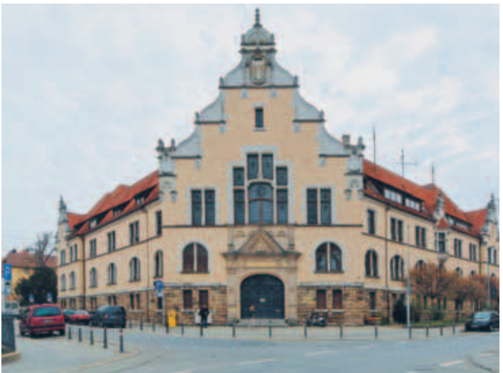
Landratsamt Hauptgebäude (Gebäude A)