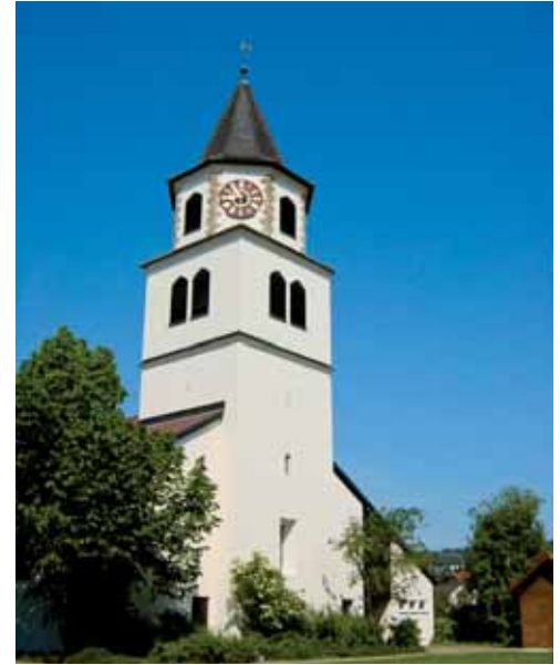
Kirche in Erpfinden