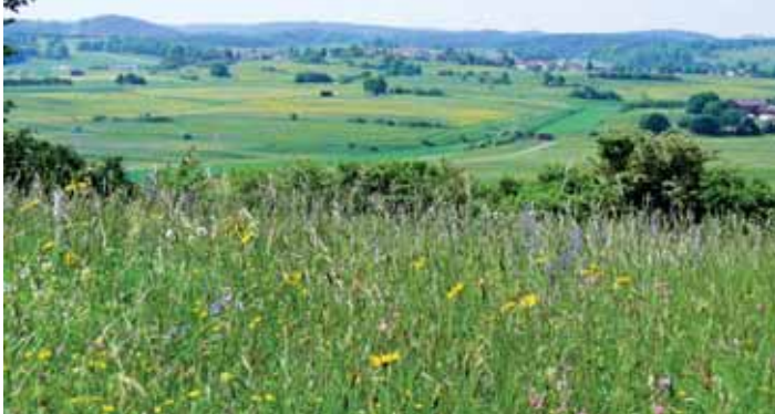
Blumenwiese in Sonnenbühl