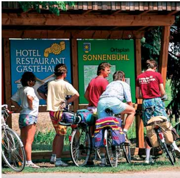
Fahrradfahrer in Sonnenbühl

Auf abschüssiger Strecke erreichen wir Willmandingen, den zweitkleinsten Ortsteil mit ca. 1.296 Einwohner. Im Ortskern von Willmandingen biegen wir nach rechts in die Bolbergstraße ein, um vor der Raiffeisenbank nach links entlang eines Armes der Lauchert durch Wiesen und Gärten in Richtung Melchingen zu fahren. Im Hintergrund zeigen sich bereits die riesigen Rotoren der Melchinger Windkraftanlage. Wir erreichen Melchingen