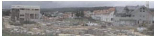
100.000 qm Naturstein-Lager