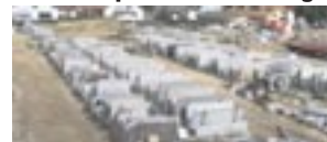
10.000 qm Rohplatten-Lager