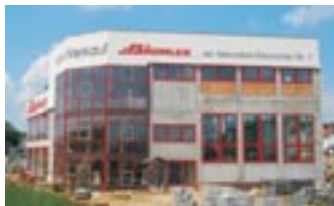
Produktions- u. Lagergebäude

Transport: Durch eigene Logistik mit modernsten LKW's jeder Größe (7,5 – 40 to) sind wir in der Lage Sie jederzeit pünktlich zu beliefern und Ihre Ware sachgerecht auf Ihrer Baustelle abzuladen