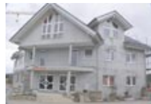
Ausstellung u. Verwaltung