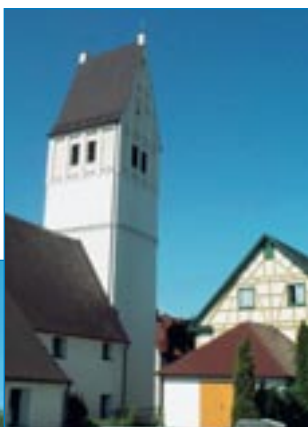
Amstetten Kirche Dorf