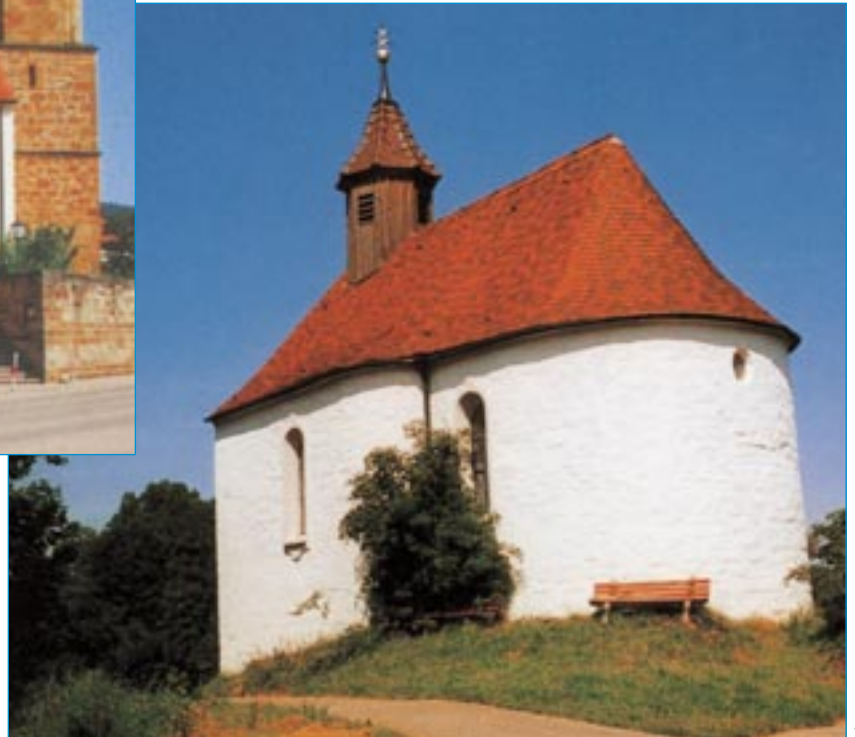
Marienkapelle bei Wißgoldingen