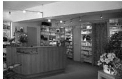
Parkplatz am Haus