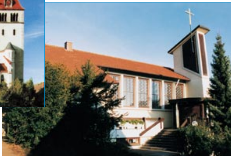
Erlöserkirche in Waldstetten