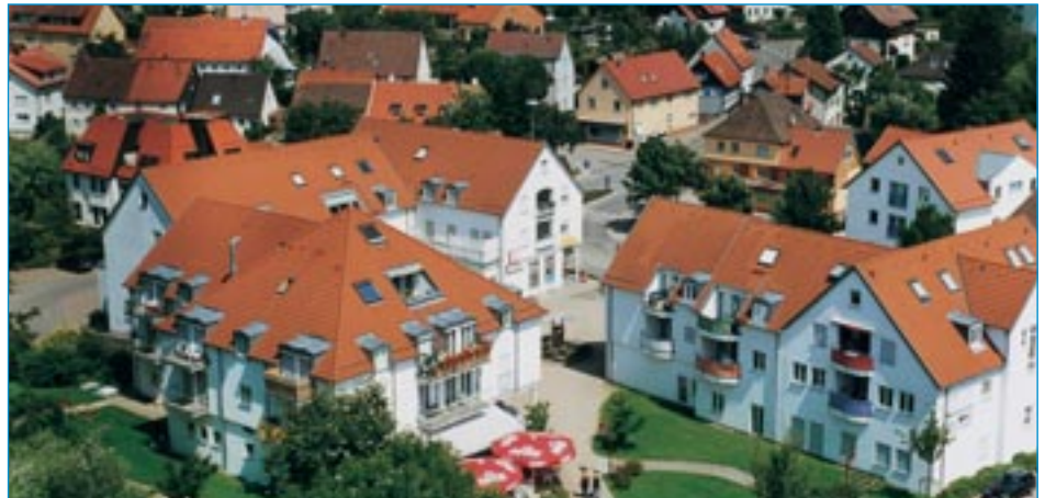
Der Malzéviller Platz in Waldstetten

Der bürgerschaftliche Sinn ist in unserer Gemeinde noch recht gut ausgeprägt. Das zeigen insbesondere unsere 65 örtlichen Vereine und Vereinigungen.