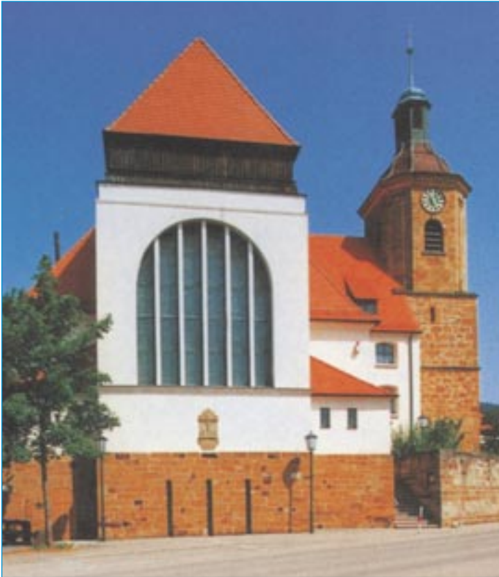
Kirche St. Johannes Baptist in Wißgoldingen