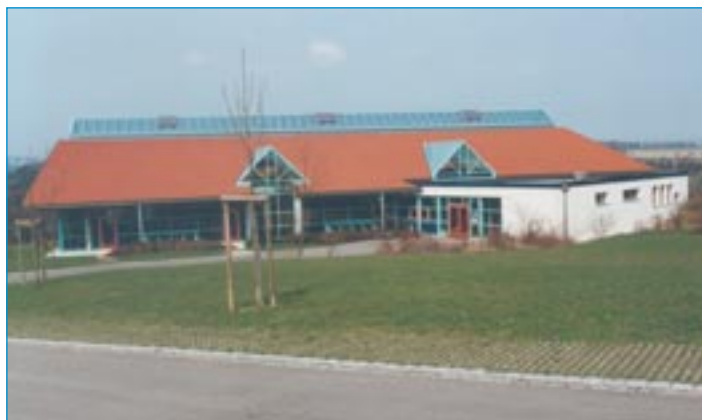
Schwarzhorn-Sporthalle in Waldstetten