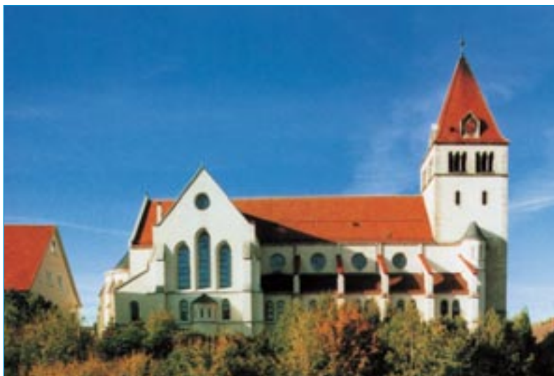
St. Laurentius Kirche in Waldstetten