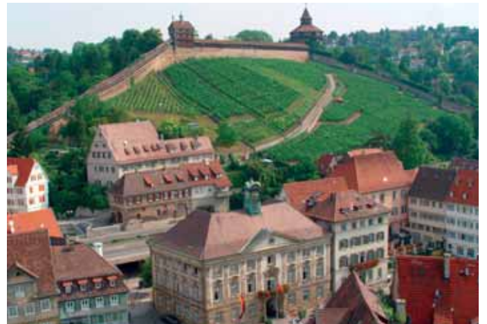
Neues Rathaus und Burg