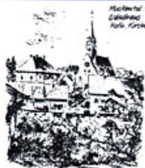
Malsbittel: Rathhaus für Kirche