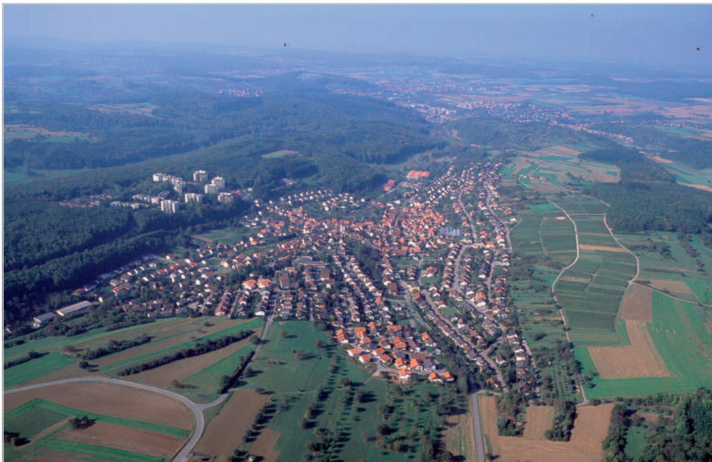
Eisingen aus östlicher Richtung vor 2000

Die Einwohnerzahl stieg vom Jahr 1960 von 1400 auf heute 4500 Einwohner. Um landschaftsschonend zu bauen, wurde für etwa 1200 Einwohner am Rande des Hauptwaldes die wunderschöne Wohnanlage „Waldpark Eisingen“ errichtet, die im Jahr 1999 ihr 25-jähriges Bestehen feiern konnte.