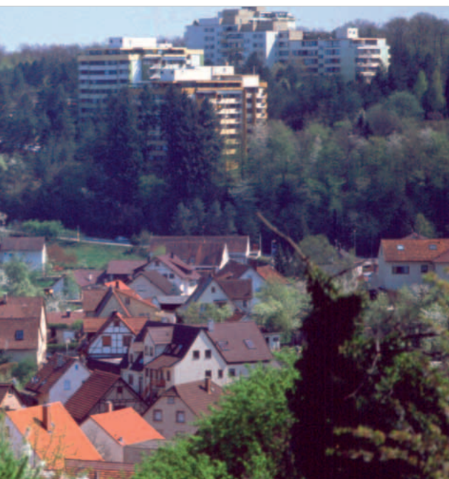
Eisingen mit Waldpark