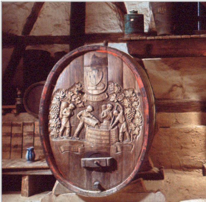
Geschnitztes Fass in der Kelter

1776 ging einer der Kelterbäume zu Bruch, der dann 1777 ersetzt wurde. Der neueste Kelterbaum ist der erste vom Eingang aus gesehen aus dem Jahr 1903. Bis 1949 wurde in diesem ehrwürdigen Gemäuer noch gekeltert. Seit diesem Jahr steht den Eisinger Winzern in der Waldstraße eine neue Kelter zur Verfügung.