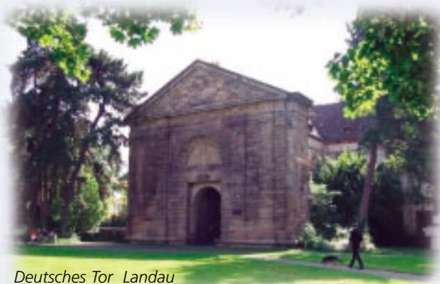
Deutsches Tor Landau

Auch die zahlreichen Feste, die in der Südpfalz ganzjährig Saison haben, leisten einen Beitrag hierzu.