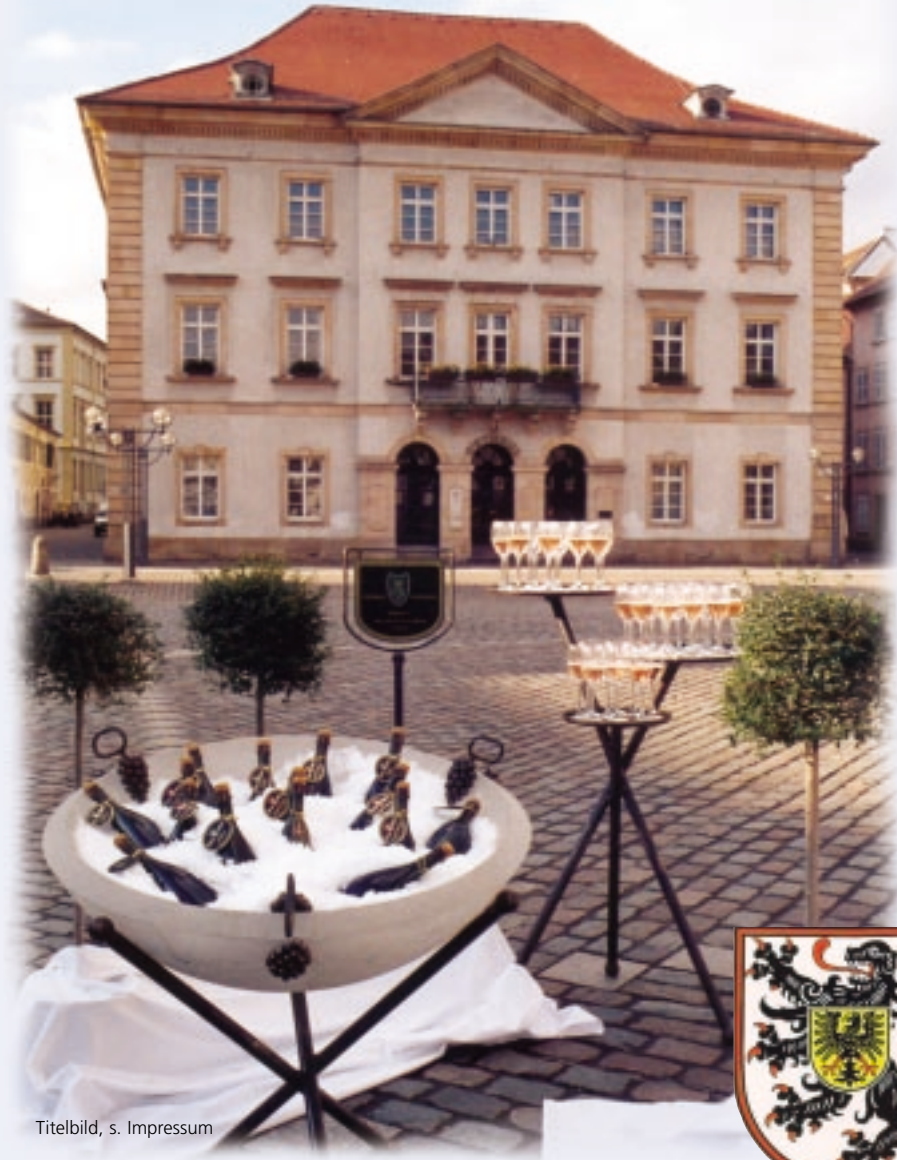
Titelbild, s. Impressum