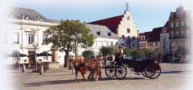
Rathausplatz mit „Landauer“

Auch wenn der eine oder andere Hochzeitsgast großzügig anbietet „Ich mache Fotos, darum braucht ihr euch nicht zu kümmern“ – empfehlenswert ist es immer, für den schönsten Tag im Leben einen professionellen Fotografen zu engagieren.