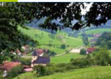
Prinzbach – Blick ins Obertal mit Kirche im Vordergrund

Der staatlich anerkannte Erholungs-ort Biberach befindet sich im reizvollen Kinzigtal, einem der schönsten Täler des Schwarzwaldes. Unweit südlich erstreckt sich das Harmersbachtal. Der heute von Handel und Gewerbe, vom Fremdenverkehr und von der Landwirtschaft geprägte Ort wurde bereits im Jahr 1220 erstmalig urkundlich genannt. Biberach war früher ein Haufendorf mit mehreren Zinken und der Ortsteil Prinzbach war im Mittelalter eine bekannte Silberbergwerkstadt. Die ebenen Wege im Tal und die waldreichen Höhen um Biberach bieten sich für erholsame Wanderungen, aber auch für Biketouren an.