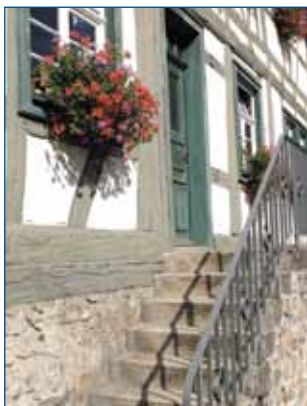
Treppe Museum Kettererhaus

Agentur für Arbeit Hauptstraße 6 77756 Hausach Servicetelefon 0180 1555111