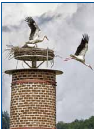
Jedes Jahr nisten auf dem Rietsche Kamin Störche