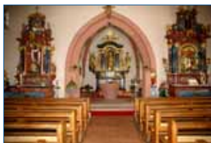
St. Mauritiuskirche Prinzbach