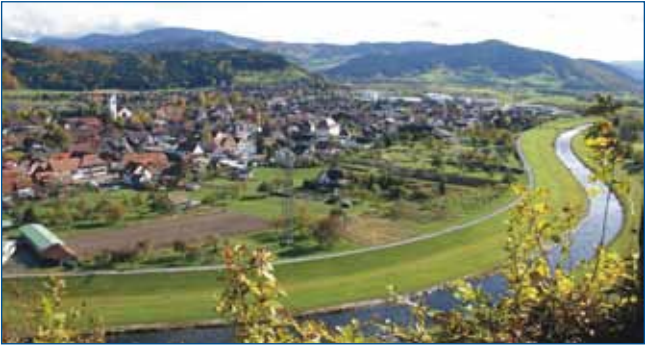
Ansicht Kinzig und Ort