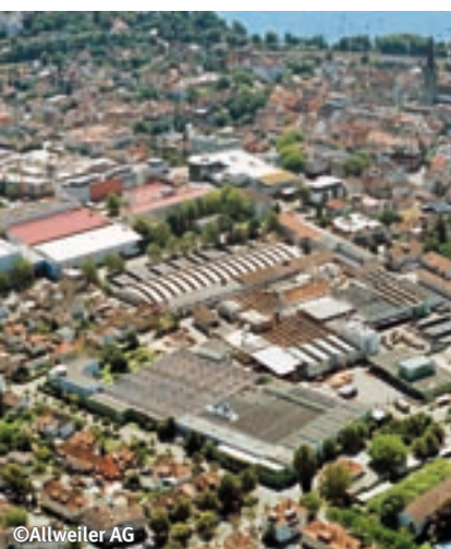
Das Firmengelände der Allweiler AG, einem der größten Arbeitgeber der Stadt