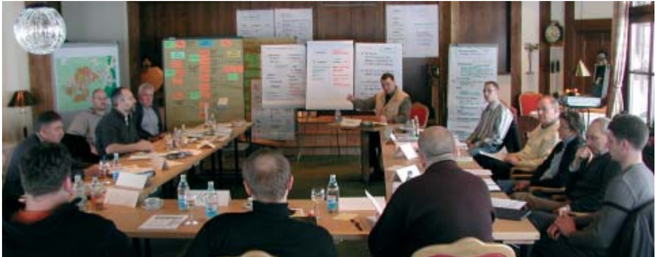
Klausurtagung des Gemeinderats im Februar 2005

Kommunalpolitisch interessierte Bürger sind bei den öffentlichen Sitzungen des Gemeinderates gern gesehene Gäste. Die Sitzungen des Gemeinderates finden i.d.R. zweimal monatlich donnerstags um 19.30 Uhr im Sitzungssaal des Rathauses statt. Die genauen Termine sind der Homepage der Gemeinde Tuningen zu entnehmen. Die Einladung mit Tagesordnung, sowie wichtige Beschlussfassungen werden im Amtsblatt und im Internet veröffentlicht.