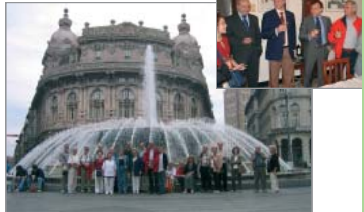
Maiausflug nach Camogli

Zum Ausbau und zur Förderung der partnerschaftlichen Beziehungen wurde daraufhin am 3. November des gleichen