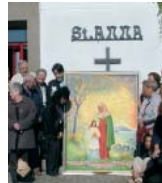
Vor der katholischen Kirche