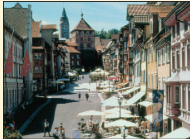
Fußgängerzone Obere Hauptstraße