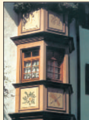
Erker in Rottweil

Rottweil hat so manches an Einzigartigem und Sehenswertem zu bieten; die Stadt lohnt eine Entdeckungsreise, öffnet sich dem wachen Auge, teilt sich dem mit, der sich um sie bemüht.