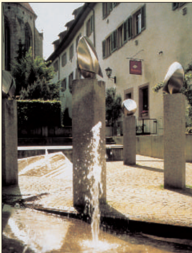
Innenhof Neues Rathaus