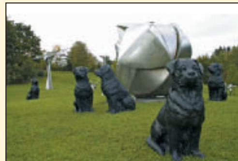
Aktion Rottweiler Hunde