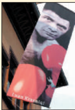
Empfang für Boxprofi Luan Krasniqi