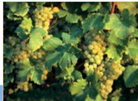
Weintrauben bei Buggingen, Markgräfler Land

Besuchen Sie die Gemeinde Buggingen. Es lohnt sich !