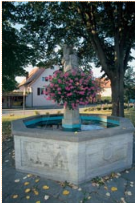
Dorfbrunnen in Buggingen, Markgräfler Land

Nach Kriegsende kamen zahlreiche Schweizer, Niederländer und Österreicher in das leere Dorf.