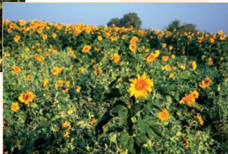
Sonnenblumenfeld bei Betberg, Markgräfler Land