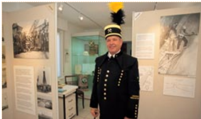
Ausstellungsraum Kali-Museum Buggingen, Markgräfler Land