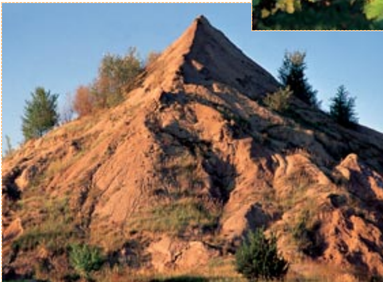
Kaliberg bei Buggingen, Markgräfler Land