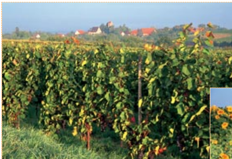
Rebanlagen bei Betberg, Markgräfler Land