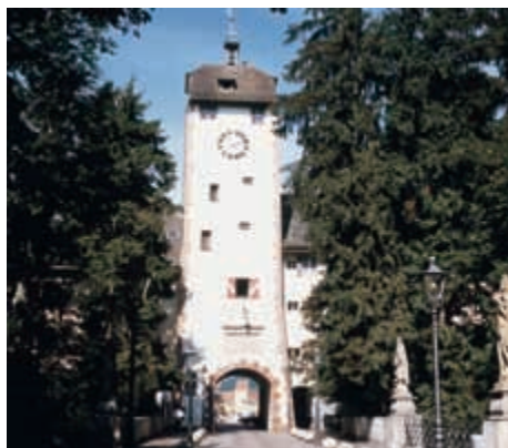
Oberes Tor – Waldshut