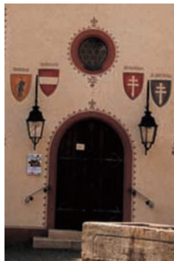
Alte Spitalkapelle Zum Heilig Geist in Waldshut