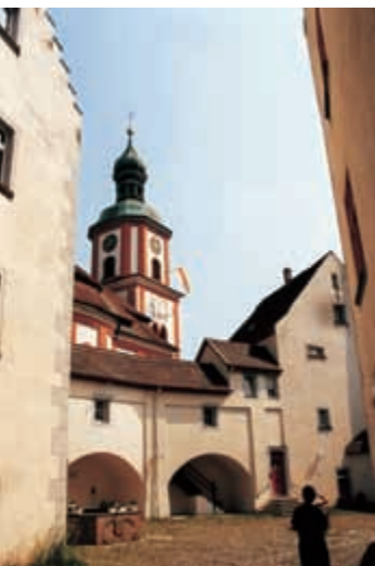
Kath. Stadtpfarrkirche Maria Himmelfahrt in Tiengen