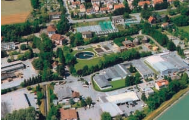
Gewerbegebiet Untere Au