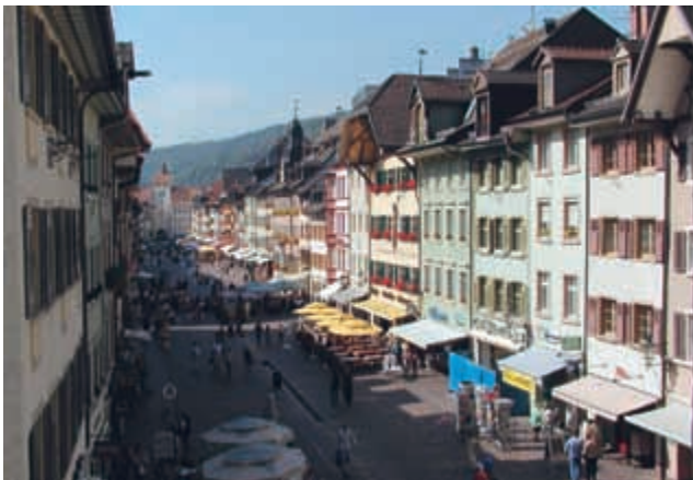
Kaiserstraße in Waldshut

Schweiz kommen. Träger der Waldshuter Chilbi, in deren Mittelpunkt ein Dankgottesdienst steht, ist die Junggesellschaft 1468, eine der ältesten Zünfte der Bundesrepublik, auch die Schützengesellschaft Waldshut ist ein mit der Stadt Waldshut von altersher verbundener Verein. Im Festzug an der Chilbi wird immer ein Schafsbock mitgeführt, von dem die Überlieferung sagt, dass die Waldshuter Junggesellen bei der Verteidigung der Stadt 1468, als die Not am größten war, einen Schafsbock über die Stadtmauer zu den Schweizern warfen, um ihnen zu zeigen, dass die Eidgenossen an ein Aushungern der Stadt nicht zu denken bräuchten. Im Mittelalter wurden viele Stiftungen gegründet; die bedeutendste ist das Spital im Jahr 1411, auf die das heutige Krankenhaus zurückgeht, das immer noch als Stiftung verwaltet wird. 1524/25 schloss sich Waldshut dem Bauernkrieg und der Reformation an. In der Stadt weilten Thomas Münzer und Balthasar Hubmaier. Waldshut musste sich jedoch bald wieder Österreich unterwerfen und verlor viele Privilegien, die es nach und nach zurückerhielt. 1633 wurde Waldshut dreimal von den Schweden und den kaiserlichen Truppen erobert und erlitt in jenen Jahren schwere Schäden. 1727 bis 1748 erhoben sich die Bauern des Waldvogteigebietes in den Salpeterkriegen gegen das Haus Österreich und belagerten mehrmals die Regierungsstadt Waldshut. 1803