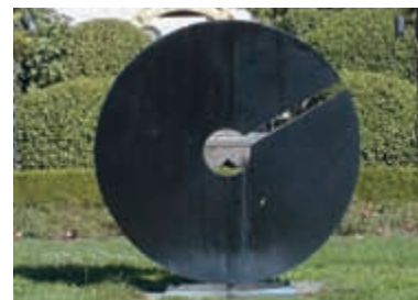
Skulptur im Schlossgarten in Tiengen

Tourist-Information Wallstraße 26-28 0 77 51/8 33-2 00 tourist-info@waldshut-tiengen.de