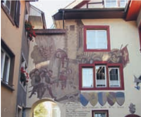
Sgraffito in Tiengen

schöne gotische Häuser in der Zuber- und Priestergasse, das Haus Stocker, die ehemalige Zehntscheuer und der Storchenturm, eines der Wahrzeichen Tiengens, und der Aussichtsturm auf dem Vitubuck.