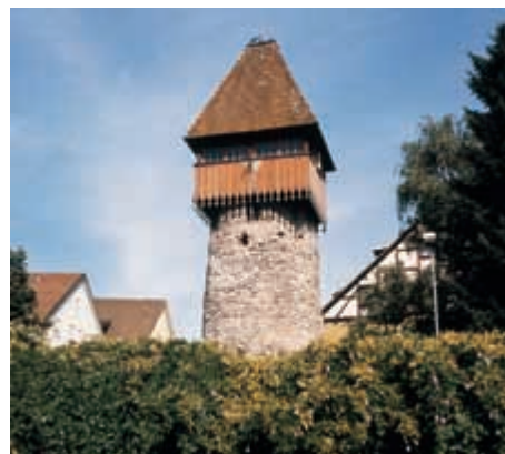
Storchenturm – Tiengen