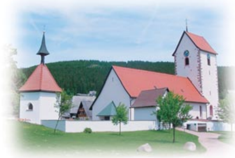
● Pfarrkirche Saig