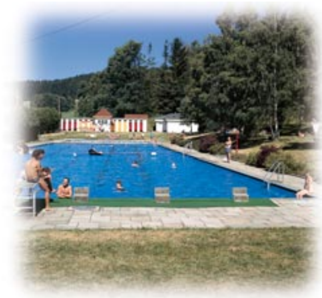
● Freischwimmbad Kappel