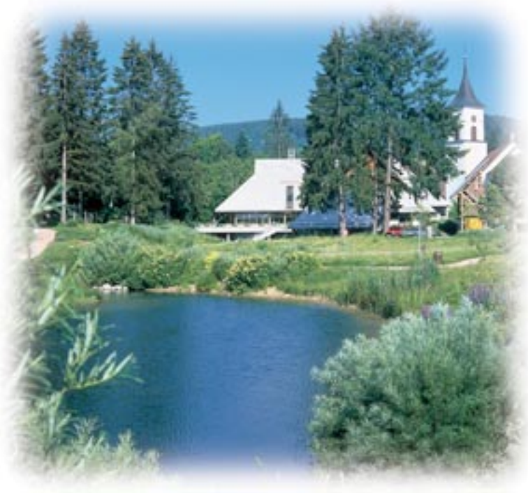
● Kurhaus Lenzkirch

In der Hochfirshalle werden in der Regel die kulturellen Veranstaltungen im Ortsteil Kappel durchgeführt. Aber auch für sportliche Veranstaltungen ist die Mehrzweckhalle geeignet. Bücher können Sie in der Kur + Touristik, Erlenbachweg 4, ausleihen.