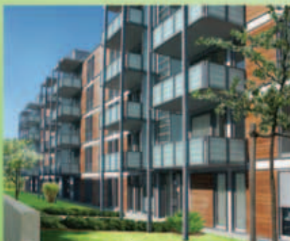
Haustyp 4 – Oslo (München Modell)