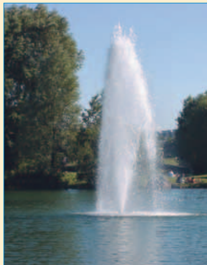
■ Fontäne im Ostpark

Wer diese Wege benutzt, wird durch ein Stadtviertel geführt, welches so viel Grün zwischen der Wohnbebauung und den Straßen aufzuweisen hat, wie kein anderes. Er wird die großzügigen Anlagen entdecken und stets in den gepflegten Parks Orte der Ruhe und Entspannung, oder auch zum Spielen finden. Besonders hervorzuheben sind die vielen