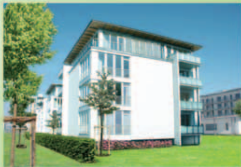
Haustyp 1 – Edinburgh (frei finanziert)

Hochwertige Mietwohnungen mit Massivholzparkett Eiche in allen Wohnräumen!