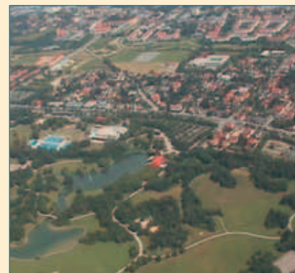
■ Blick auf den Ostpark

Kilometer Alleen, welche sowohl den Fuß- und Radwegen Schatten spenden, als auch alle Straßen in diesem Stadtviertel säumen.