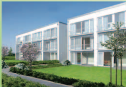
Haustyp 2 – Helsinki (München Modell)