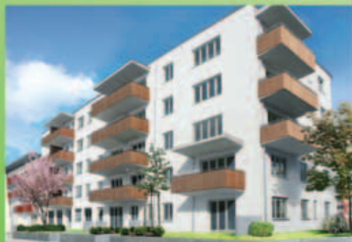
Haustyp 3 – Stockholm (München Modell)