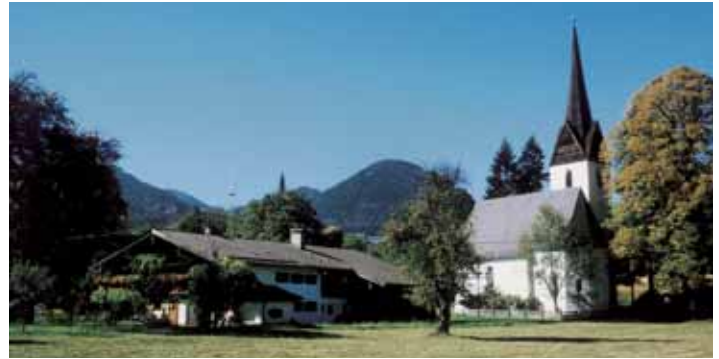
St. Ägidiuskirche mit dem „Niedermayer-Anwesen“ erstmals erwähnt 1440

Zur Propstei Petersberg gehörten der Rieder und der Strein, zur Herrschaft Falkenstein der Obermoar und Schachl (später zu Brannenburg), der Niederheckner und der Bruckner sowie der Schmid Toni. Zur Ägidiuskirche gehörte der Mesner, zur Kirche in Brannenburg der Schrott. Der Straßer zinst zur Kirche in Berbling und der Mauermeister zum Kloster Tegernsee. Anfang des vorigen Jahrhunderts waren freie Güter beim Kistler und beim Oberheckner. Im Jahr 1843 hatte die Ortschaft Degerndorf 21 Häuser, darunter zwei Schmieden und das Kistlerhaus. Damals gehörten 16 Häuser zum Patrimonialgericht Brannenburg und die übrigen fünf zum königlichen Landgericht in Rosenheim.