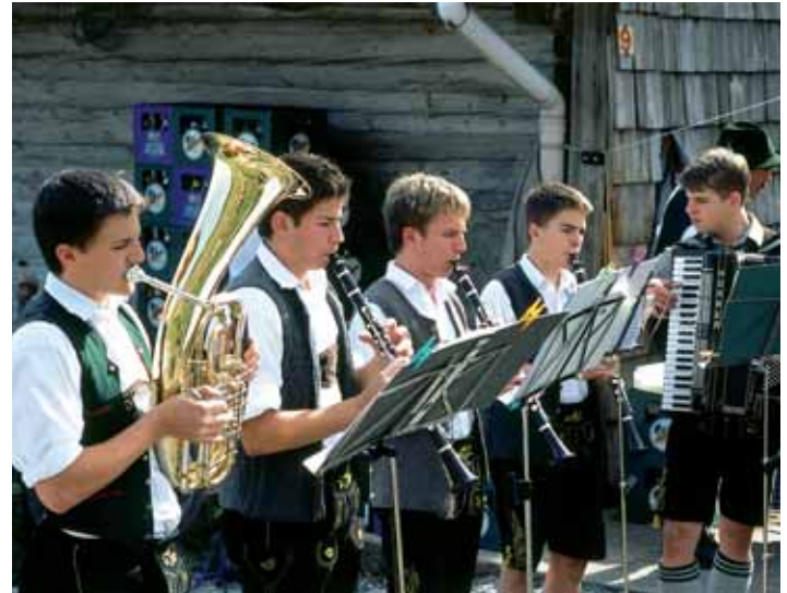
Musik auf der Alm