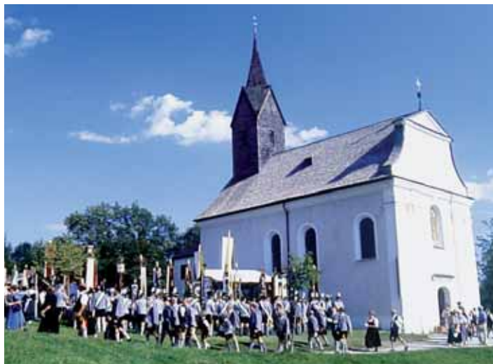
Kirche mit Prozession

*Herr Pallauf ist am besten vormittags und Donnerstag nachmittags zu erreichen.