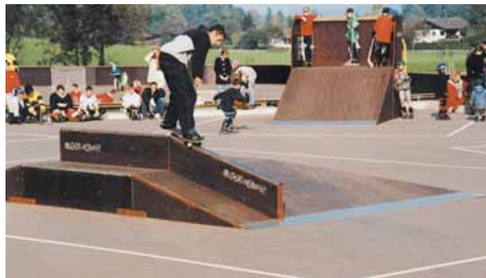
Basketball- und Streethockey-Platz, Skateranlage