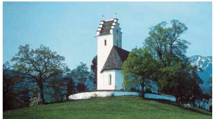
Kirche in St. Margarethen

In der Bevölkerung hieß es zwar immer „St. Margarethen“. Bei der Zusammenlegung 1978 hatte die Gemeinde 264 Einwohner.