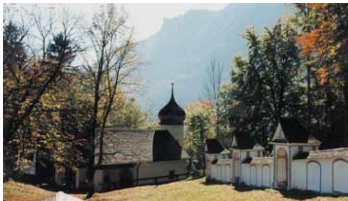
Wallfahrtskirche St. Magdalena auf der Biber