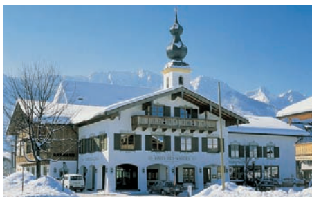
Rathaus der Gemeinde Inzell mit Haus des Gastes

Gemeinde Inzell Rathausplatz 5 83334 Inzell ☎ 08665/9869-0 Fax: 08665/9869-50 E-Mail: info@gemeinde-inzell.de