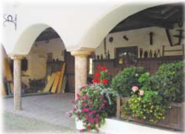
Alte Wagnerei in Hoheneggkofen