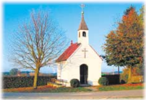
Kapelle in Eichtet