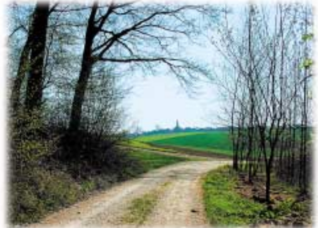
Blick auf Obergangkofen