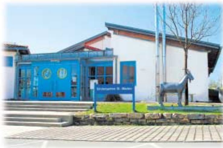
Kindergarten St. Marien