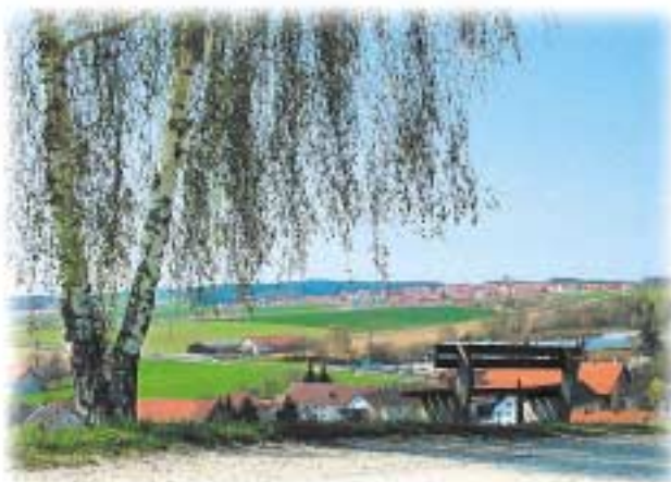
4 Blick von Kumberg

Änderungswünsche, Anregungen und Ergänzungen für die nächste Auflage dieser Broschüre nimmt die Gemeinde Kumhausen gerne entgegen.