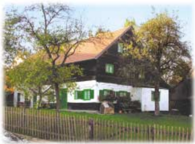
Neumeier Anwesen, Obergangkofen