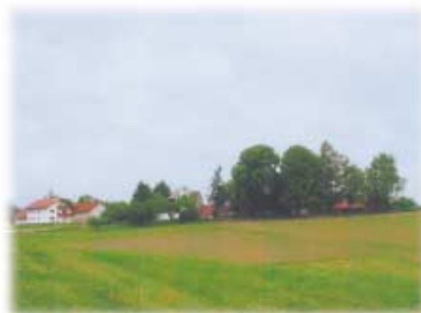
Blick auf Berndorf