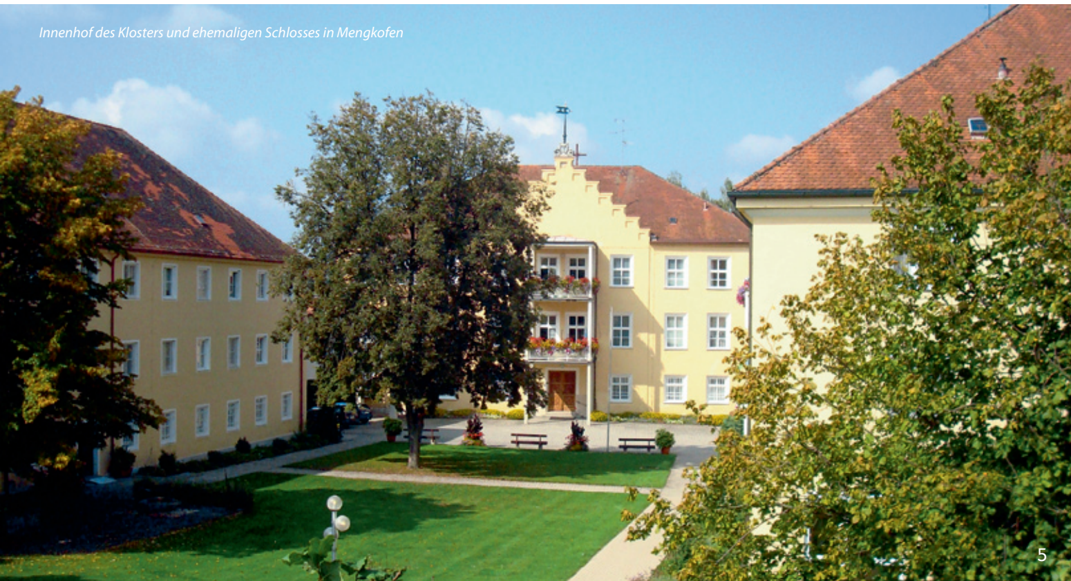
Innenhof des Klosters und ehemaligen Schlosses in Mengkofen

Mengkofen ist über die BAB 92 München-Deggendorf – Ausfahrt Dingolfing-West und die Staatsstraße 2111/2141 Dingolfing-Straubing zu erreichen. Die nächste Bahnstation ist in Dingolfing bzw. Straubing.