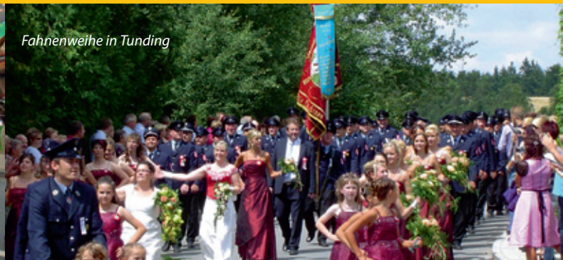
Fahnenweihe in Tunding

In und um Mengkofen gibt es viele unterschiedliche Möglichkeiten, seine Freizeit aktiv zu gestalten. Das rege und intakte Vereinsleben in unserer Gemeinde ist gekennzeichnet durch eine Vielzahl attraktiver Veranstaltungen.