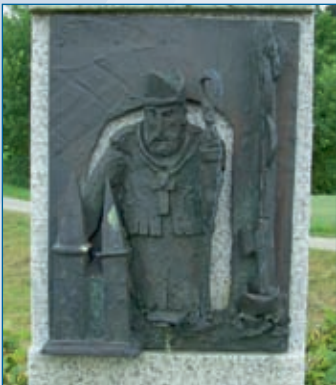
Detail Denkmal LE, Falkenberg/Taufkirchen, Nähe Furth