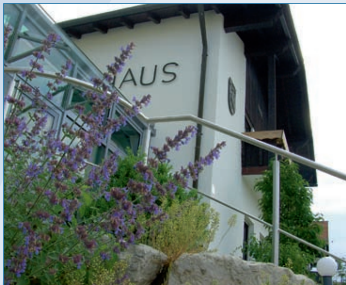
Zugang Rathaus Falkenberg