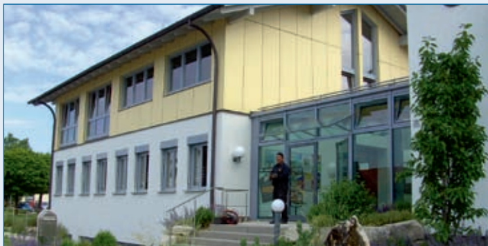
Rathaus Falkenberg mit südlichem Eingang