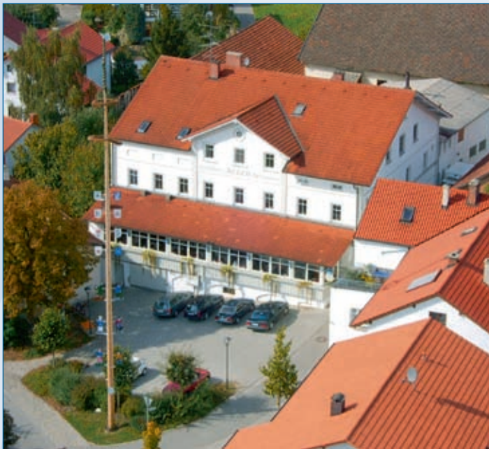
Dorfmitte Taufkirchen (GH Reger)