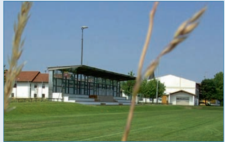
Tribüne, Sportplatz Falkenberg