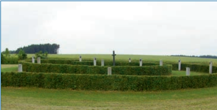
Denkmal LE, Falkenberg/Taufkirchen, Nähe Furth