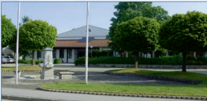
Schule und Schulbrunnen Falkenberg