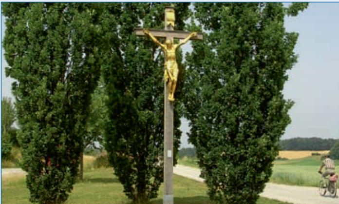
Wegkreuz bei Ruderfing/B 20