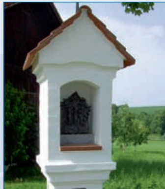
Denkmal LE Heißsprechting